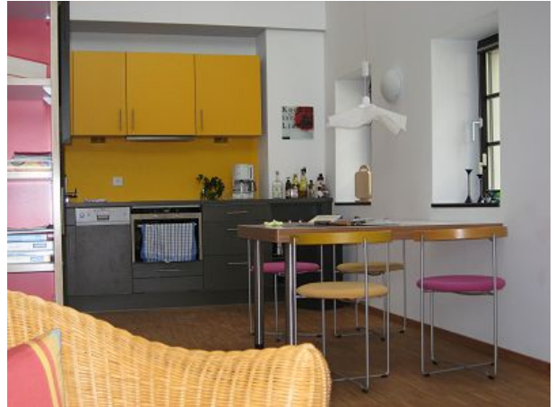
Blick auf den Essbereich