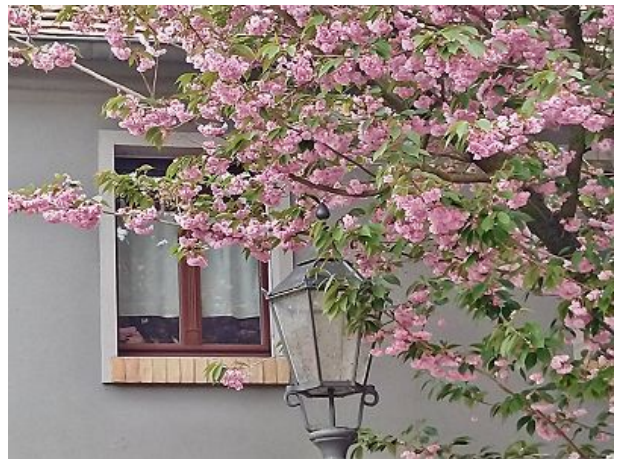
Werder im Mai