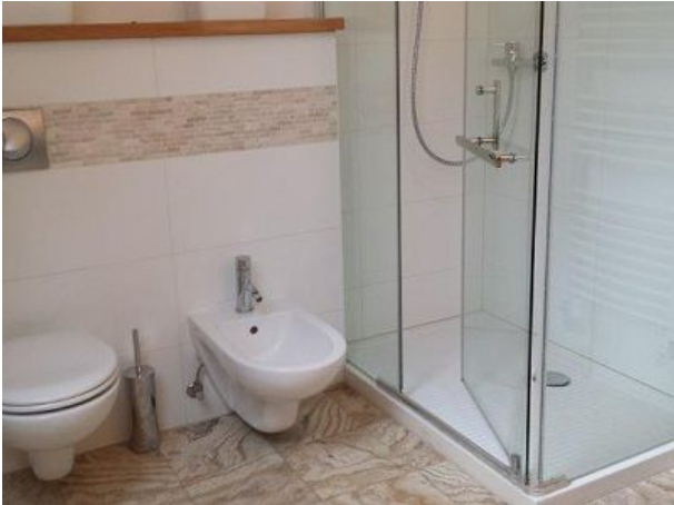
Bad mit Bidet und Grossraumdusche