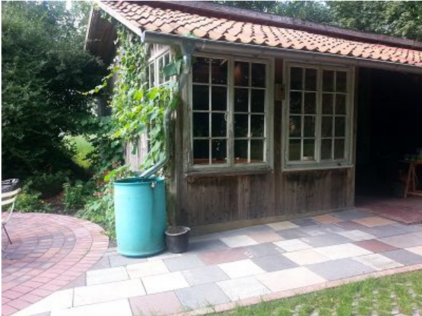
Sauna im Garten