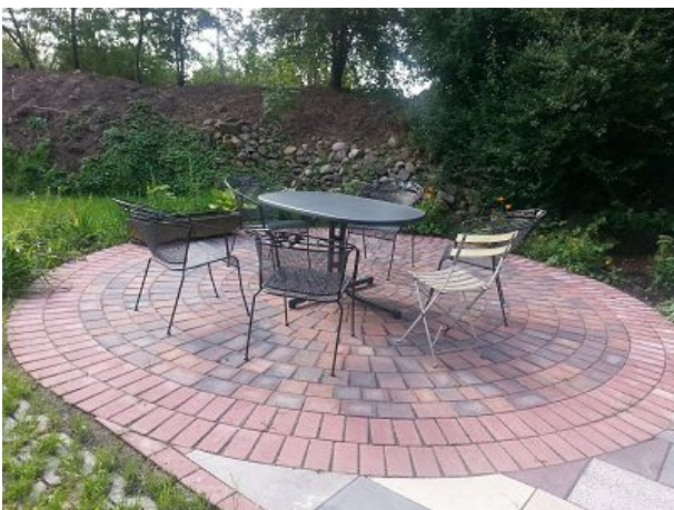
Sitzplatz im Garten