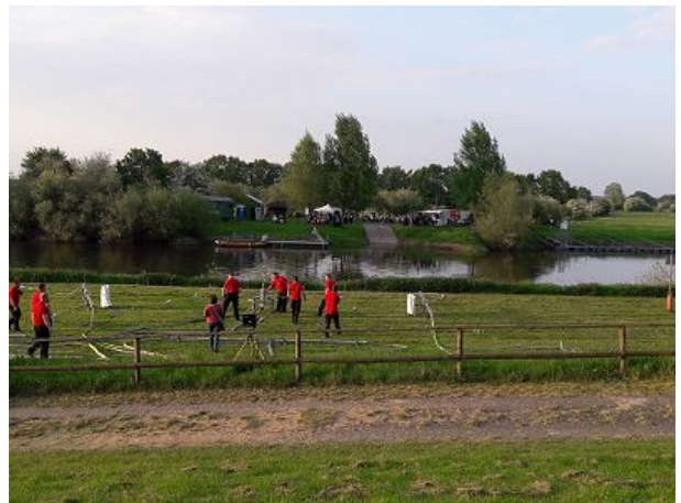
An der Aller