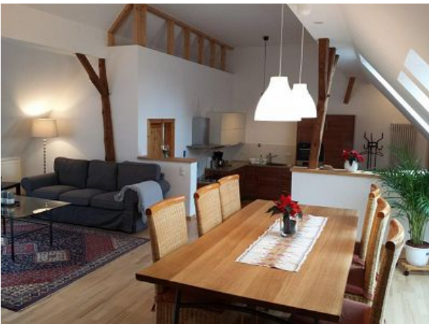
Essecke im Wohnzimmer