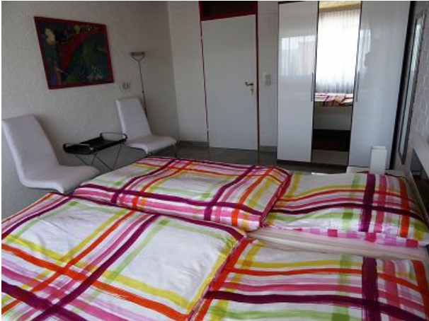
Hier kann man gut schlafen