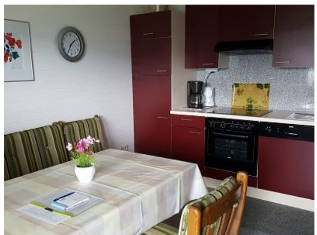
Hier kann man nicht nur essen