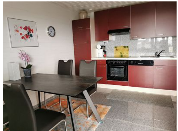
Küche mit Essecke