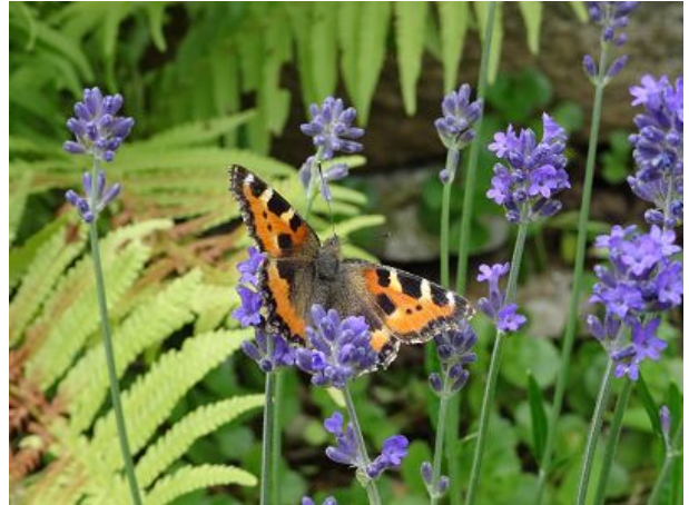
Prächtiger Besuch im Garten