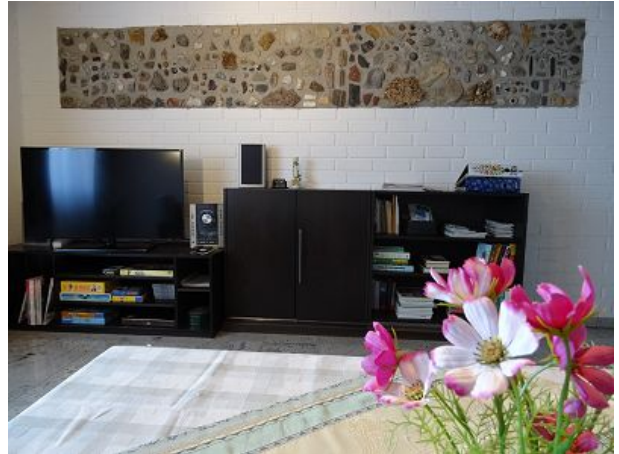
Teilansicht des Wohnzimmers