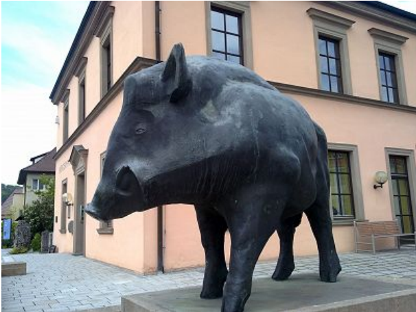
Ebermannstadt lässt grüßen