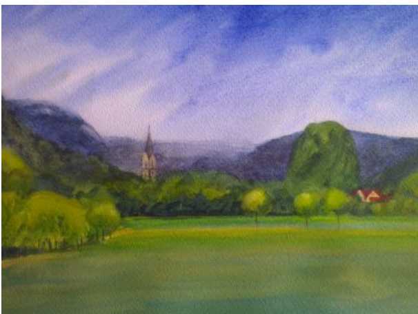
Malerblick auf Ebermannstadt