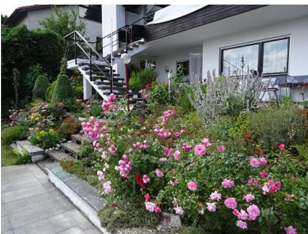
Unsere Rosen erfreuen uns lange