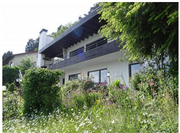
Im Frühling erfreuen die Margeriten