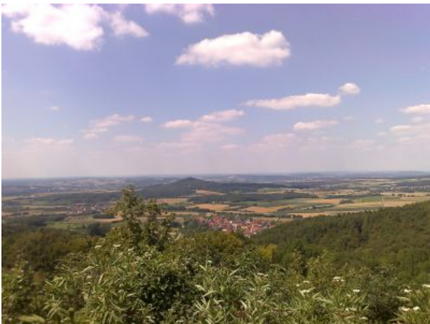
Vom Walberla in die Landschaft schauen