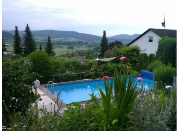
Blick auf unseren Pool