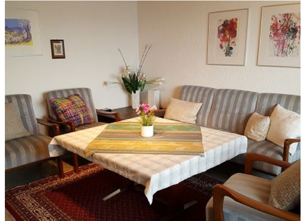
Gemütliches Wohnzimmer mit Sat-TV