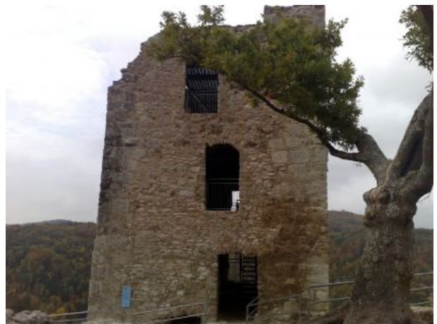
Fränkische Schweiz mit Burgen und Ruinen