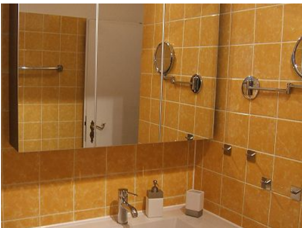
Kleine Dusche - aber modern eingerichtet