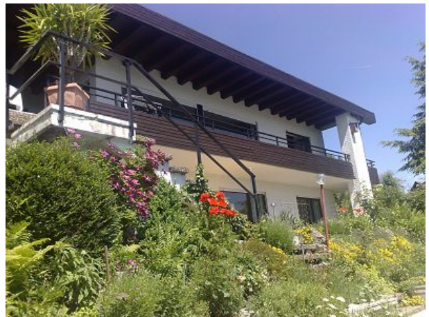
Wir lieben die Natur