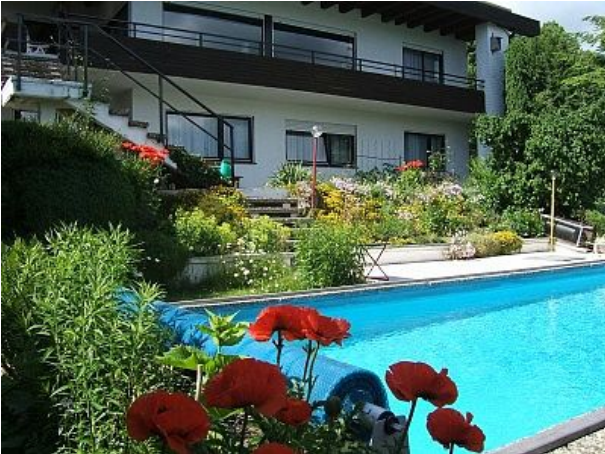
Ihre Wohnung unten mit Terrasse