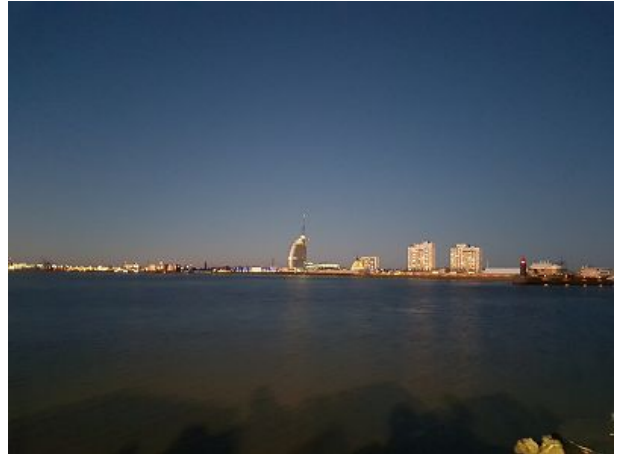
Bremerhaven von der Fähre Brake