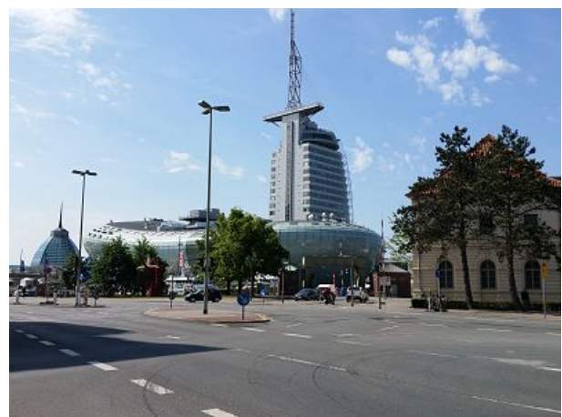
Klimahaus und Sail City