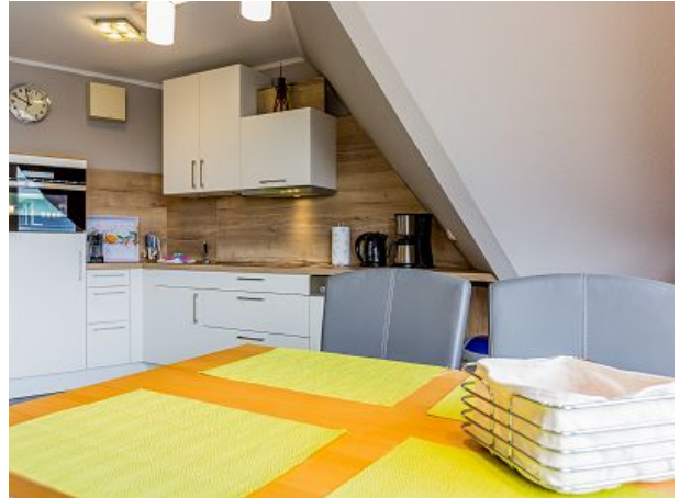
Essecke mit Einbauküche