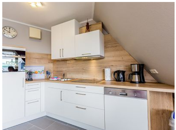
Einbauküche mit Geschirrspüler