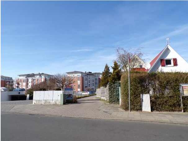
Einfahrt zur Residenz Meeresbrandung