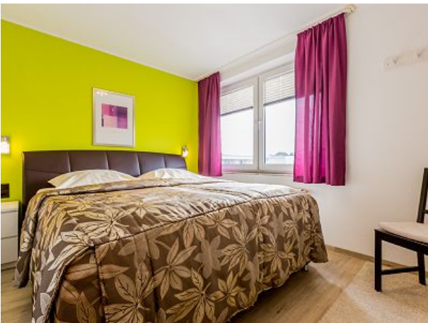
Komfortbett im Schlafzimmer zum Süden