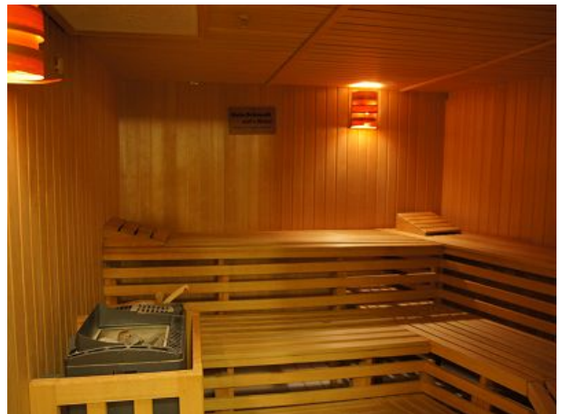
Finnische Sauna Schlafzimmer