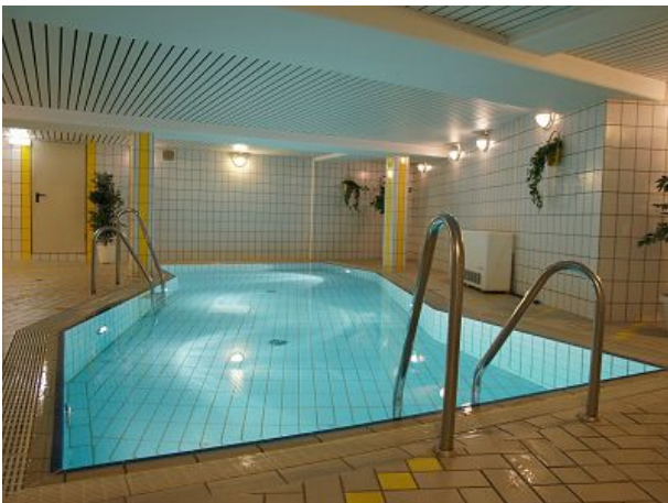
Schwimmbad im Regenerhaus