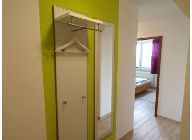
Seesicht vom Balkon