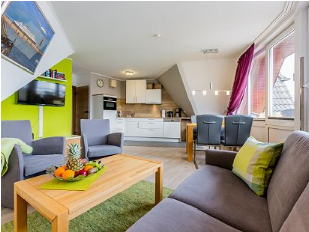
Wohnzimmer mit Einbauküche