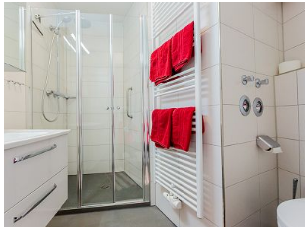
Duschbad mit WC