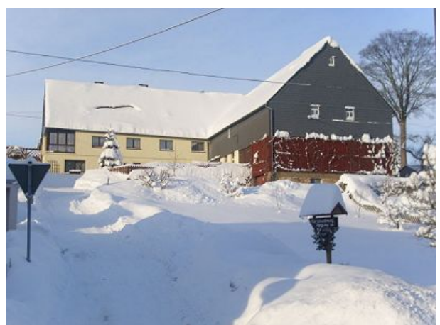
Hausansicht im Winter