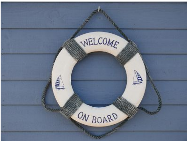
Bosse heißt Sie herzlich willkommen