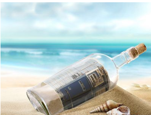
Flaschenpost für Sie