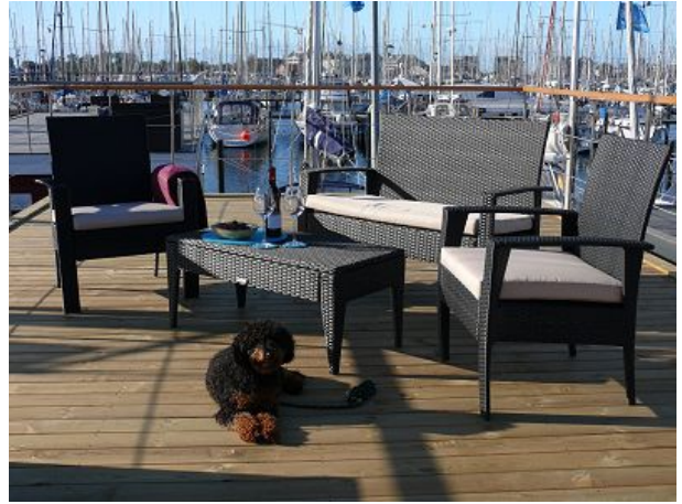
Von Dachterrasse die Segler beobachten