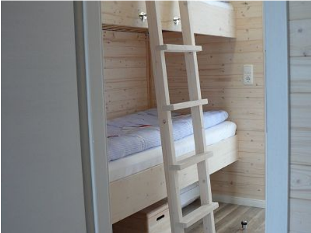
Schlafzimmer li mit Etagenbett