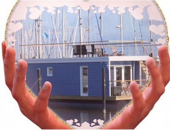
Hausboot Bosse im Herzen