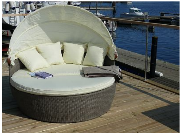
Die Insel auf dem Oberdeck