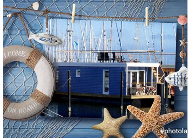
Ihr Hausboot Bosse