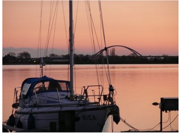
Blick auf die Fehmarn-Sund-Brücke