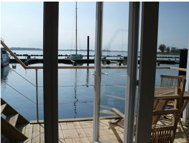
Blick aus dem Salon