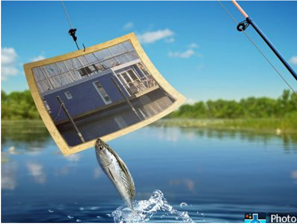
Ein Hausboot geangelt