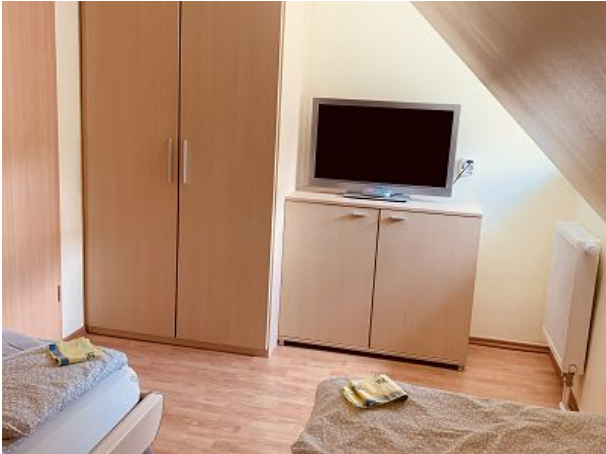
Schlafzimmer mit TV