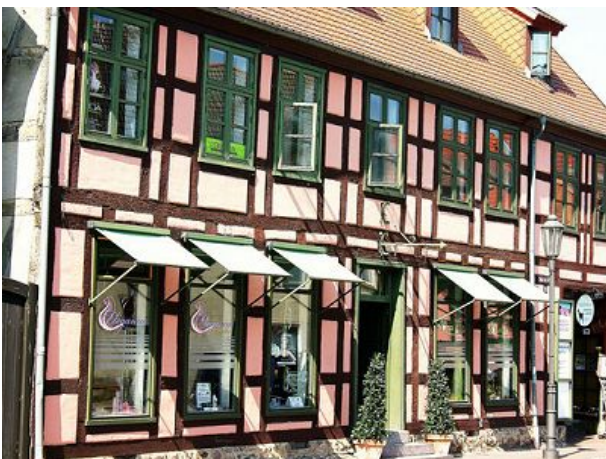
eines von vielen restaurierten Fachwerkh