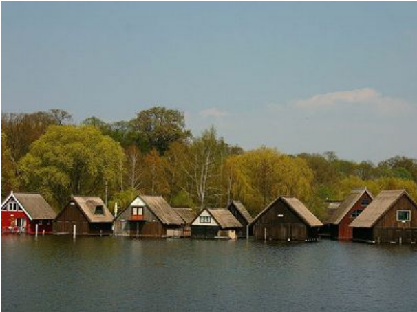
Bootshäuser in Röbel