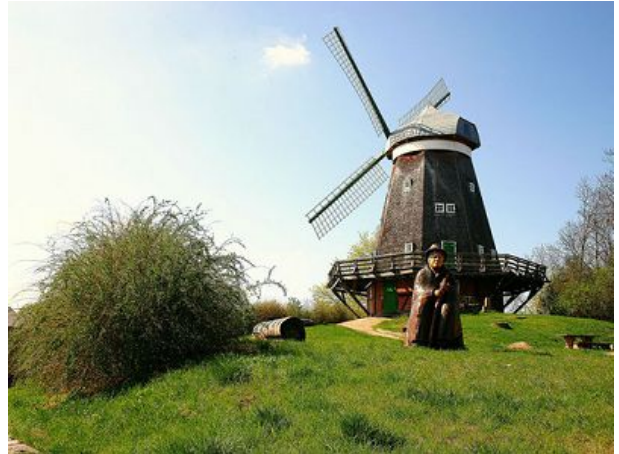
die Alte Mühle Röbel