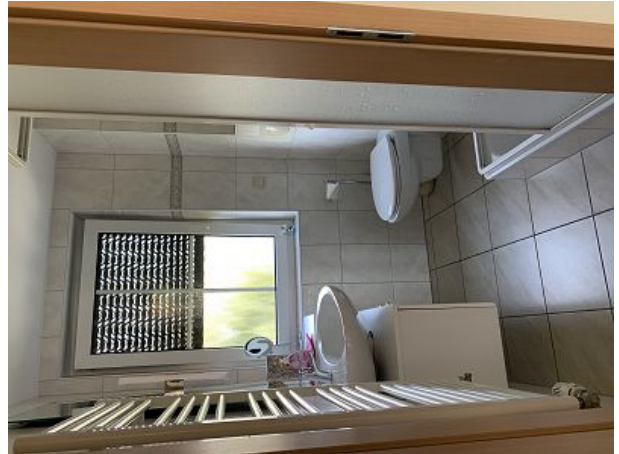
helles Duschbad mit Handtuchrockner uvm