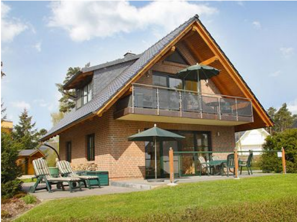
Ferienwohnung im Müritz-Ferienpark Röbel