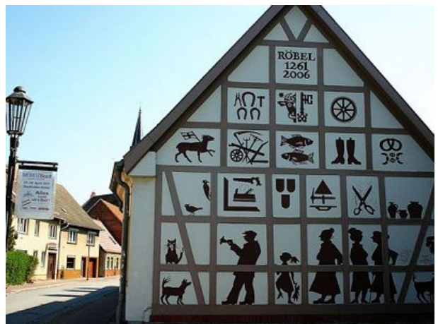
Haus des Handwerks