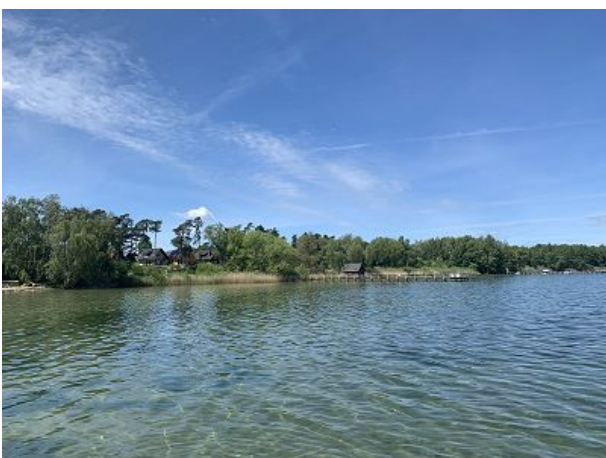
ein Katzensprung zum Wasser