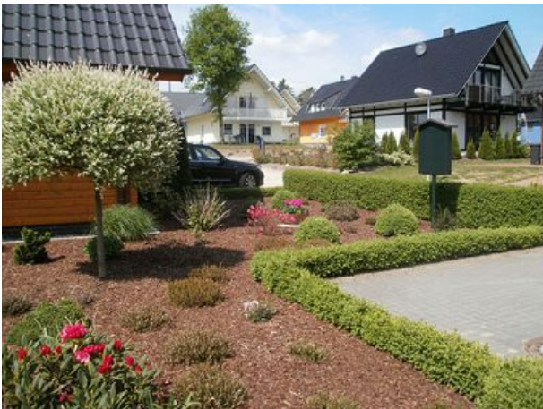
Gartenanlage zwischen unseren Häusern