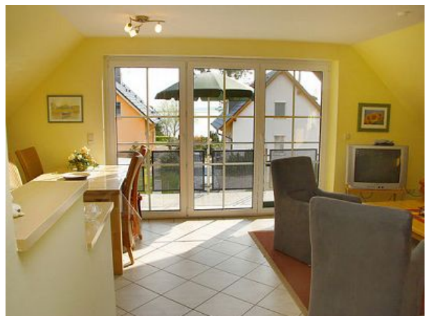
offener Wohn-Ess-Bereich Zugang Balkon