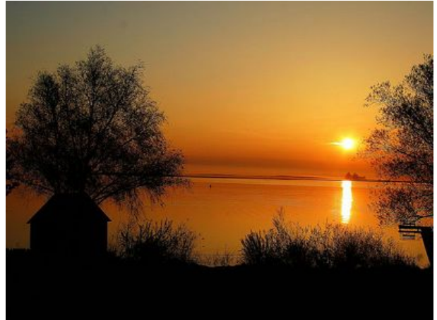
Sonnenuntergang Blick von Ferienanlage