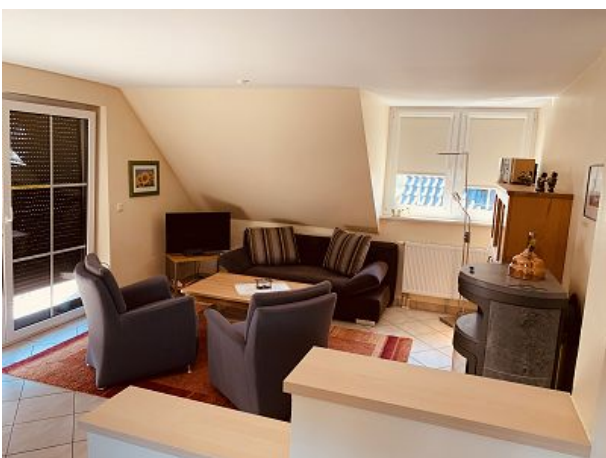
Wohnbereich mit Aufbettungsmöglichkeit