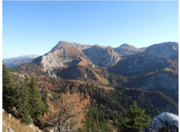
Unser Hausberg der Jenner