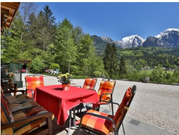
Terrasse vor dem Haus