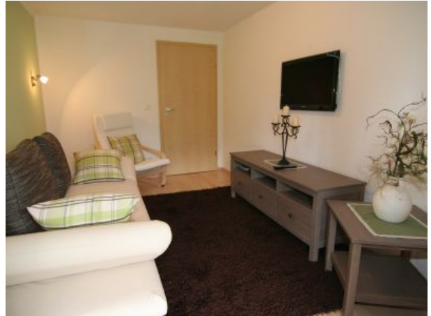
Wohnzimmer mit Flachbildschirm