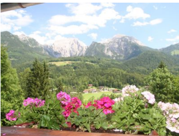
Aussicht im Sommer