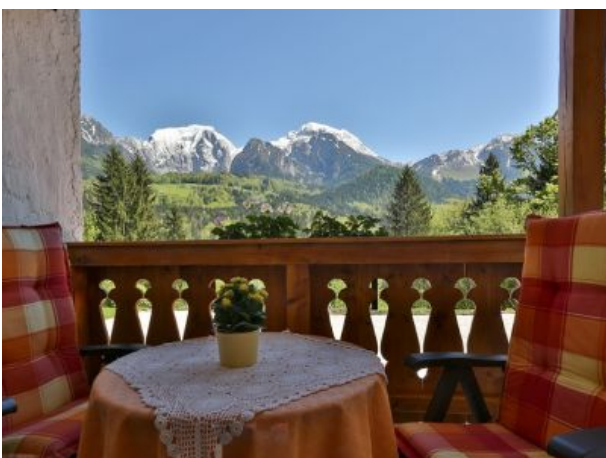
Sitzecke vor dem Haus