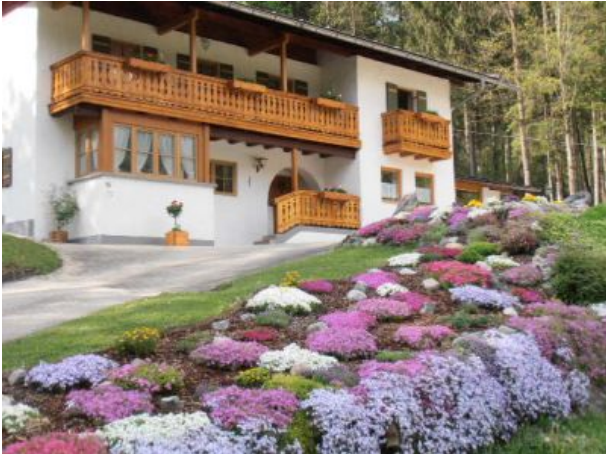
Haus mit Steingarten