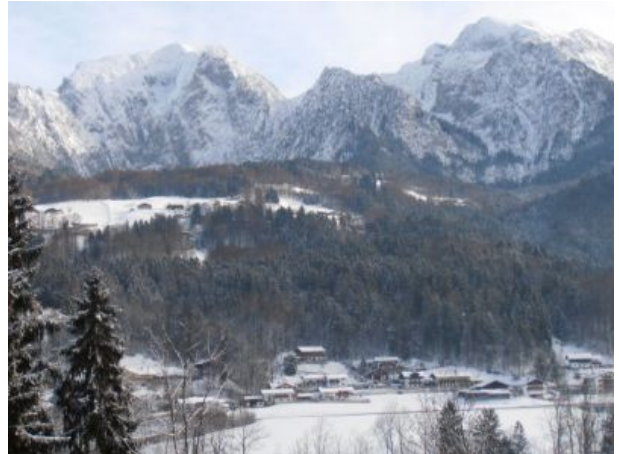
Aussicht im Winter