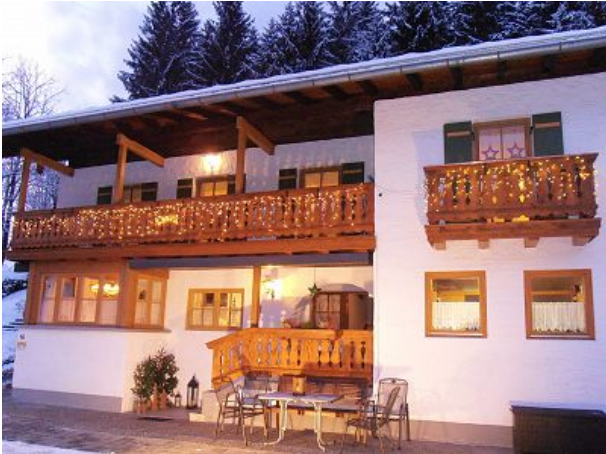
Unser Haus Weihnachten beleuchtet