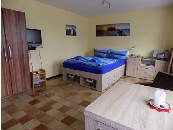
Wohn- und Schlafbereich