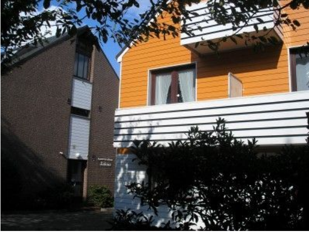
Blick zum Balkon bei sonnigem Wetter