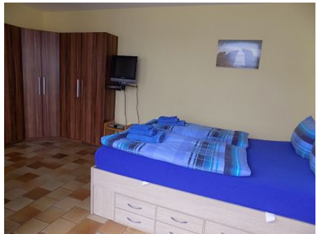
Einfach nur wohlfühlen