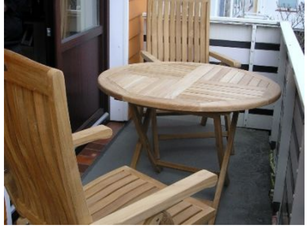
gemütliches Verweilen auf dem Balkon