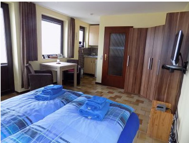
Gemütlich wie zu Hause