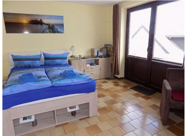
Wohn- und Schlafbereich mit Balkon