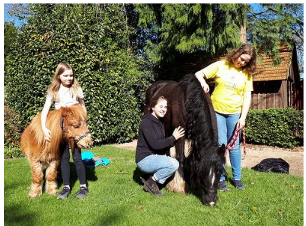
Ponys mit den Reitmädels