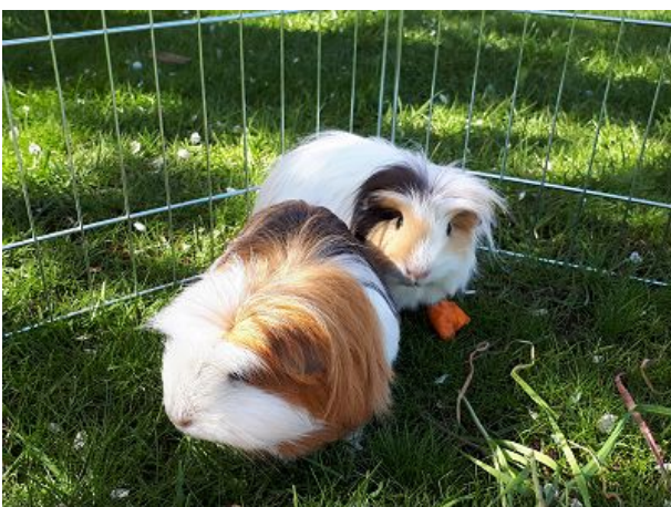
Lilli und Mimmi