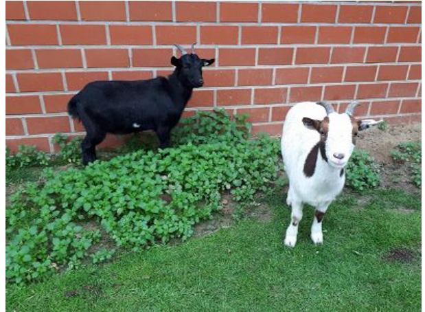
Lotti und Else