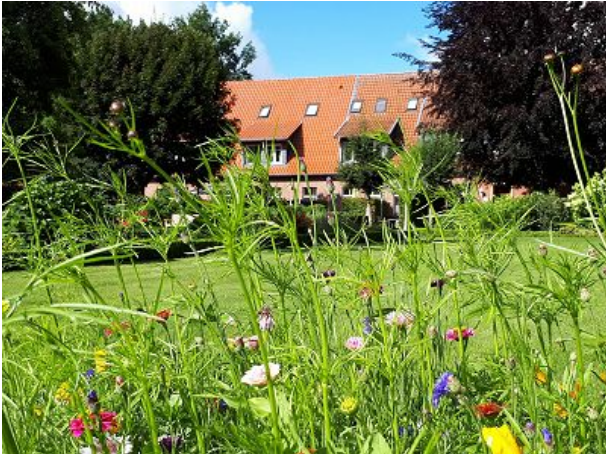
Blick durch die Blumen