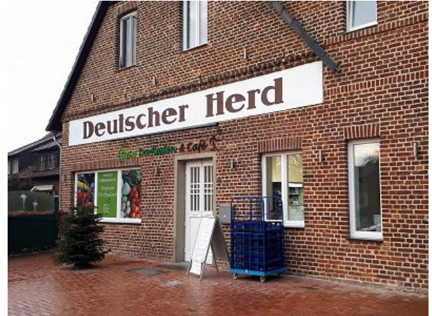
Dorfladen und Cafe