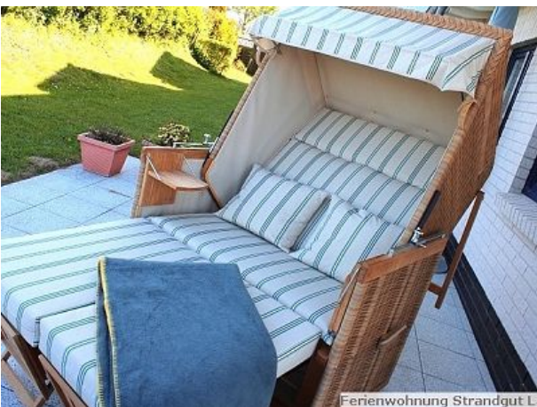
Ferienwohnung Strandgut L