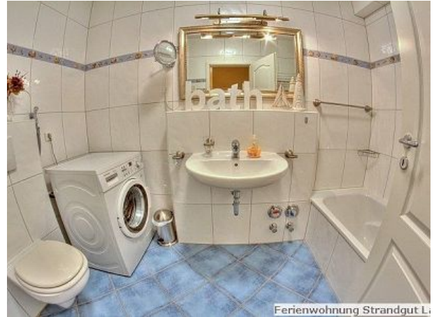
Ferienwohnung Strandgut L