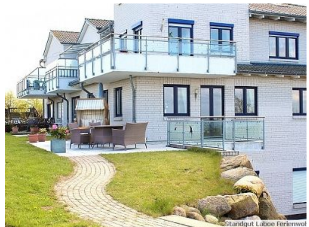
Strandgut Laboe Ferienwo