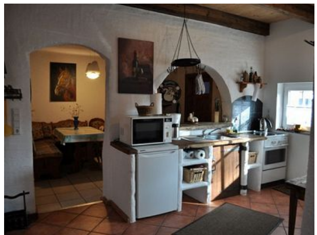
Wohnraum Ferienwohnung zwei