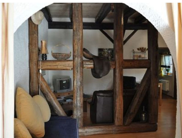
Wohnraum Ferienwohnung drei