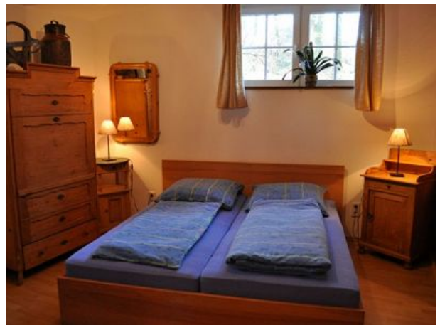
Schlafzimmer Ferienwohnung eins