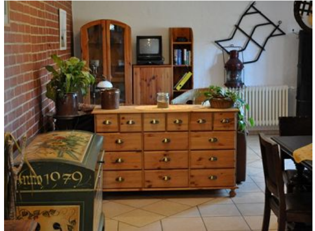
Wohnraum Ferienwohnung eins