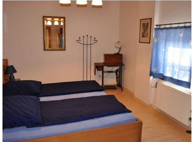
Schlafzimmer Ferienwohnung zwei