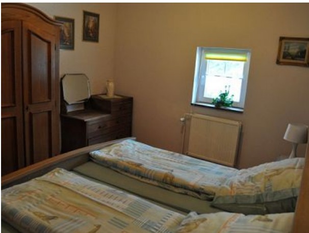
Schlafzimmer Ferienwohnung zwei