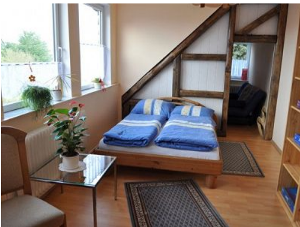
Schlafzimmer Ferienwohnung vier