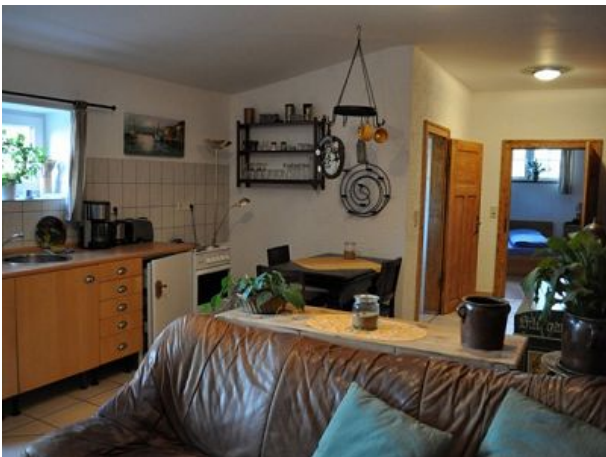
Wohnraum Ferienwohnung eins