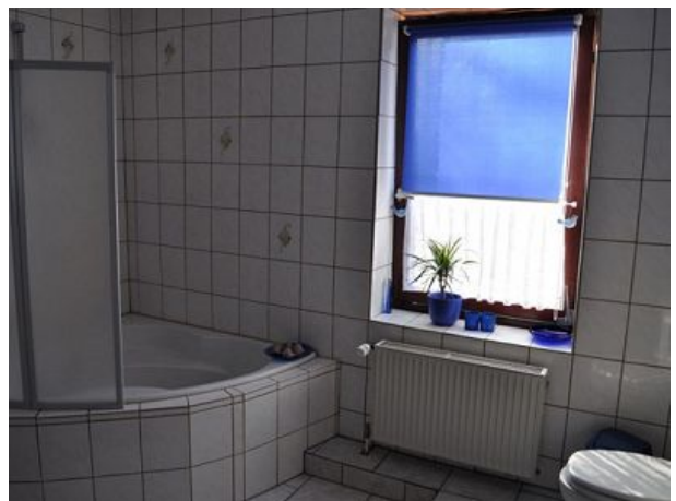
Bad Ferienwohnung vier