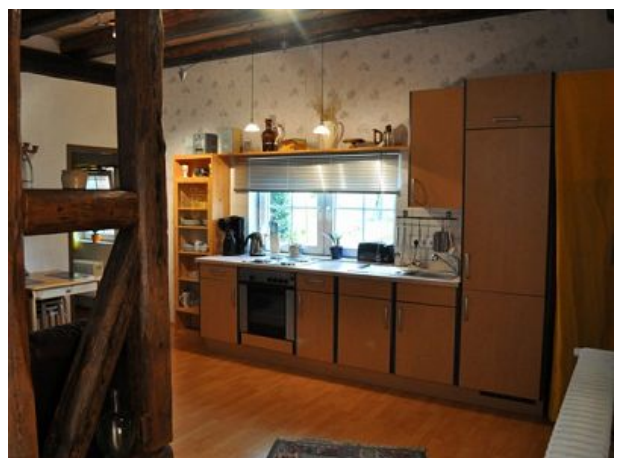
Küche Ferienwohnung drei