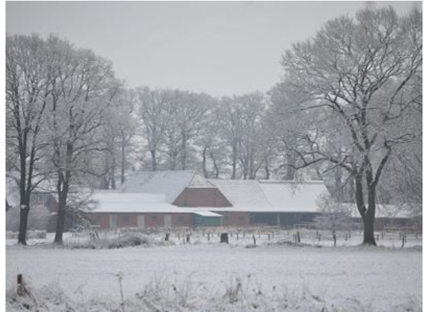
Unser Hof im Winter