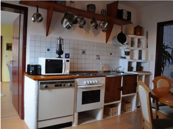
Küche Ferienwohnung vier