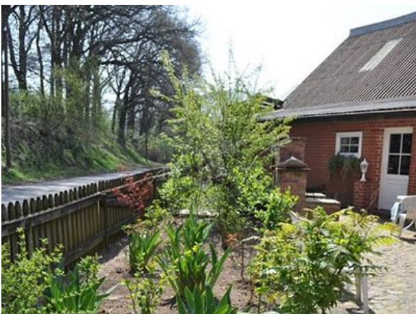
Vorgarten der Ferienwohnungen