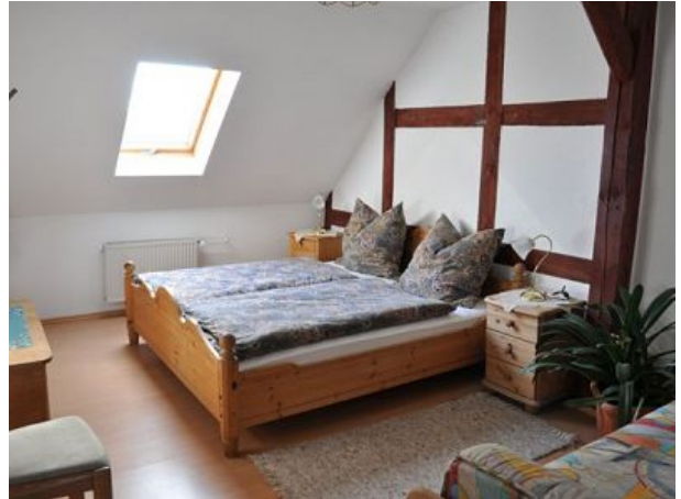
Schlafzimmer Ferienwohnung vier