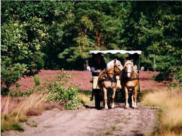
Kutschfahrt in der Brokeloher Heide