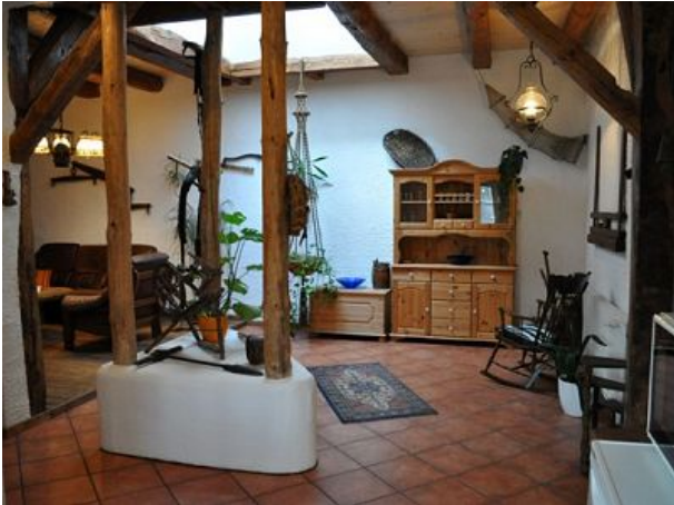
Wohnraum Ferienwohnung zwei