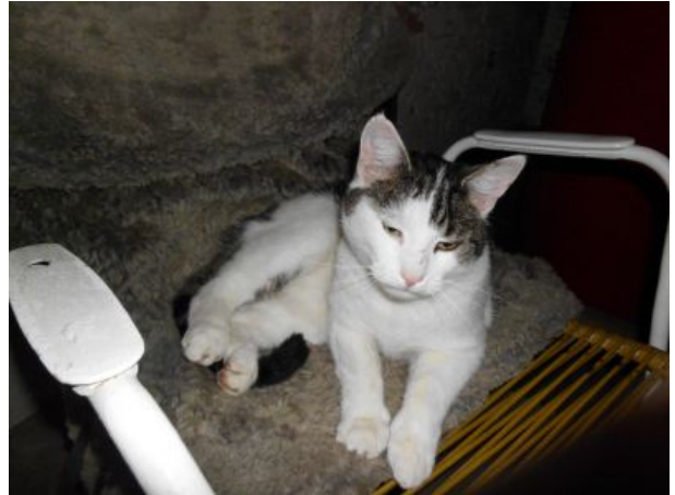
der verschmuste Hofkater ruht gern weich