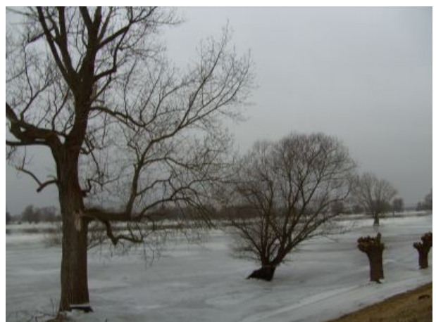
Winterhochwasser an der Elbe