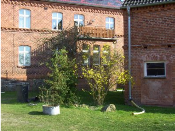
Eingang vom Hof zum Wintergarten