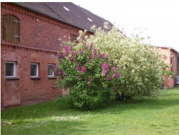
Hofansicht im Frühling