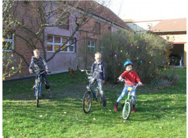
Kinder trainieren auf unseren Rädern