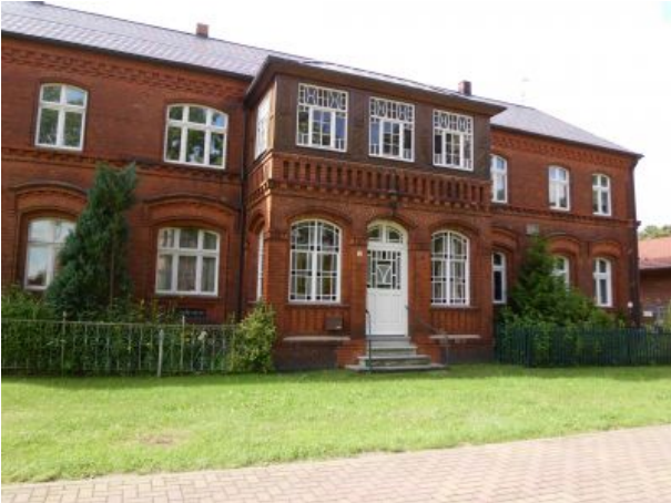
Muxfeldts Wohn- und Ferienhaus