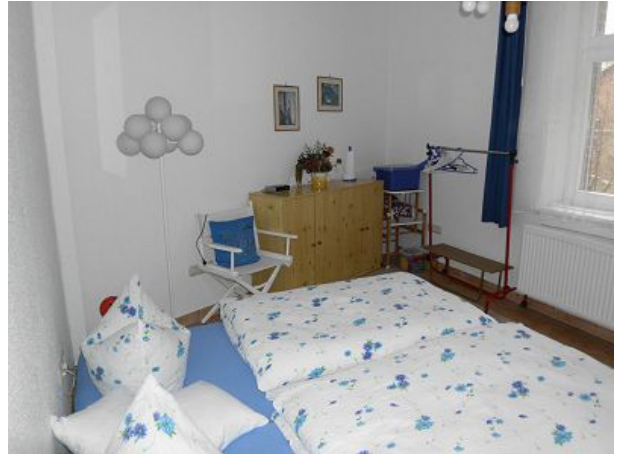
Kinderzimmer mit zwei flachen Betten