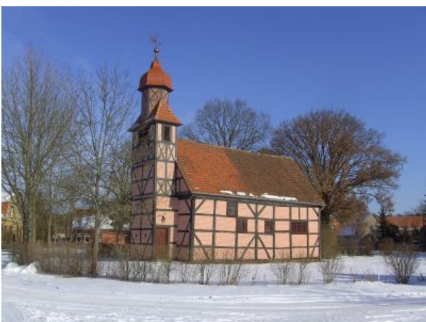
Roddans barocke Dorfkirche im Winter