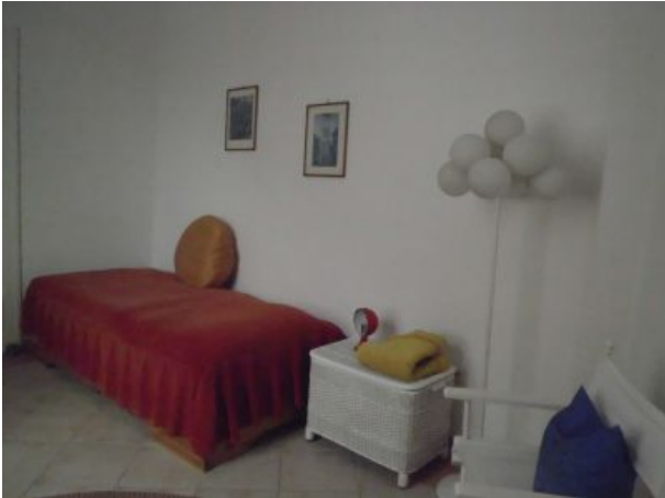
Kinderzimmer mit ein Bett für Erwachsene