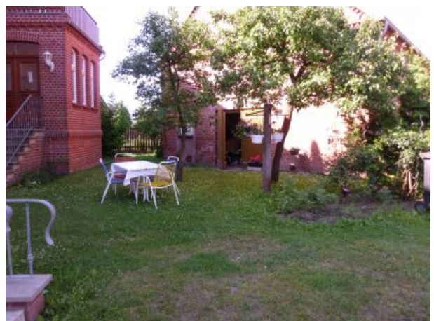
Relaxen oder Essen im Hof