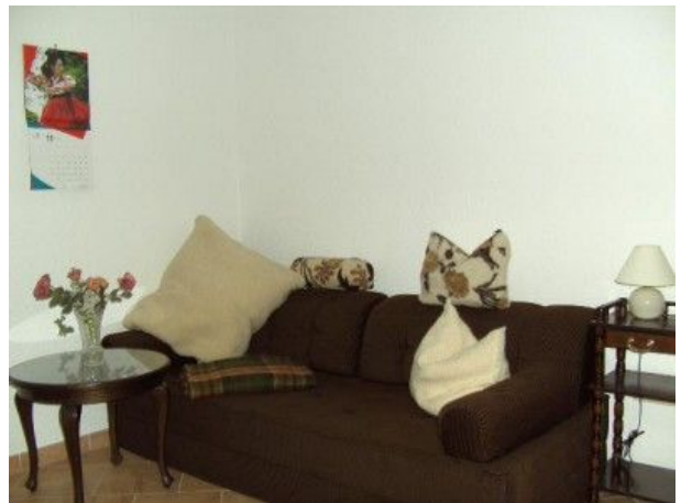
Schlafcouch im Wohnzimmer