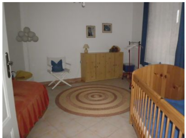
Kinderzimmer mit Kinderbett