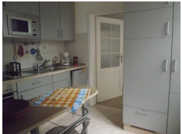
Einbauküche mit Frühstücksbar