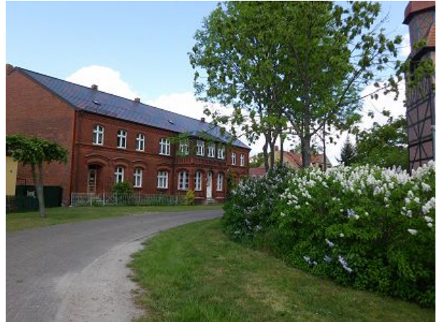
Roddaner Dorfstrasse Haus Muxfeldt