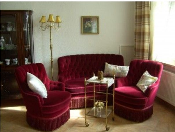
Sitzecke im Wohnzimmer