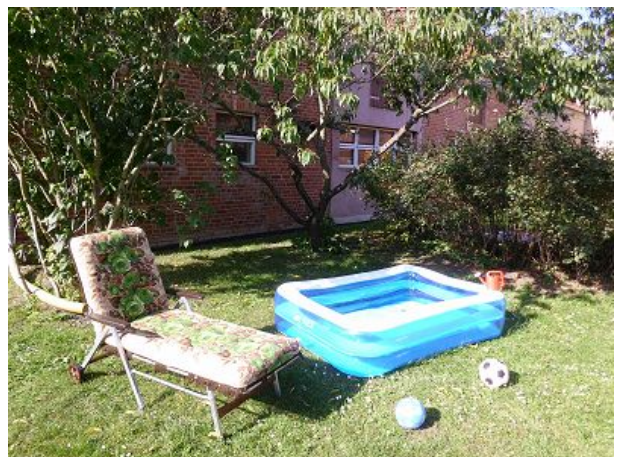
und wenn es ganz heiss wird