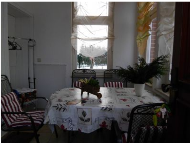
Esstisch im Wintergarten