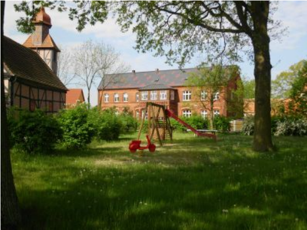
Spielplatz unser Haus im Hintergrund