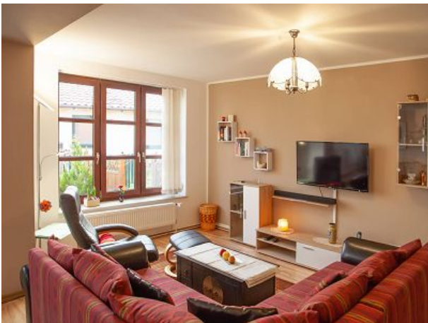
Beine hoch und ausruhen