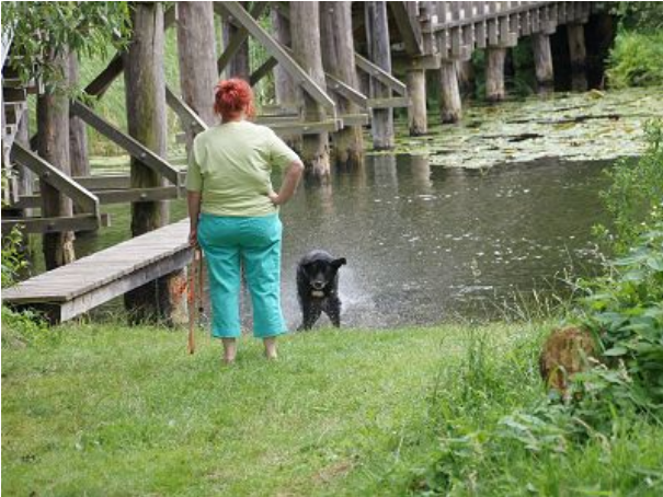
Lilly und Frauchen