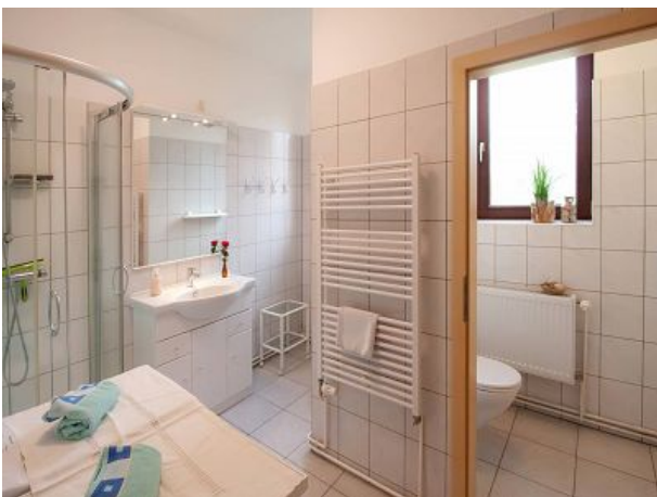
Bad separates WC