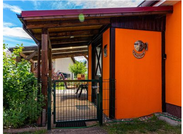
Eingang zur Morgensonne Terrasse