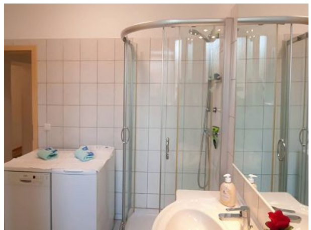
Bad Dusche Waschmaschine