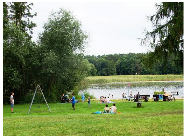
Der Strand und Spielplatz