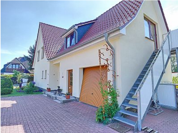
Vorplatz und Zugang zur Ferienwohnung