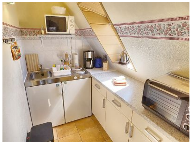
Küche und Ansicht der Ausstattung