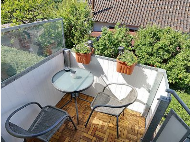
Sitzgruppe auf dem Podest