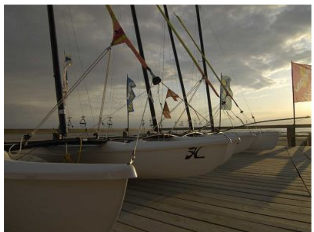
Katamarane an der Surfstation