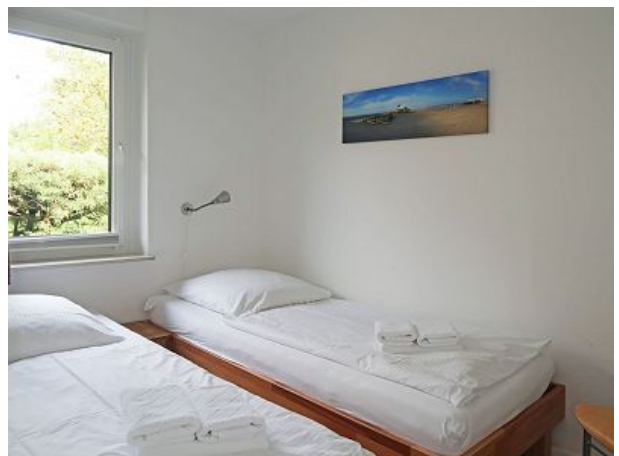
Schlafzimmer Bett geht auch als Doppel