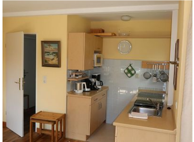
geräumige Küchezeile mit Backofen