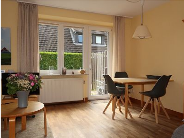
Essplatz mit Blick in den Garten