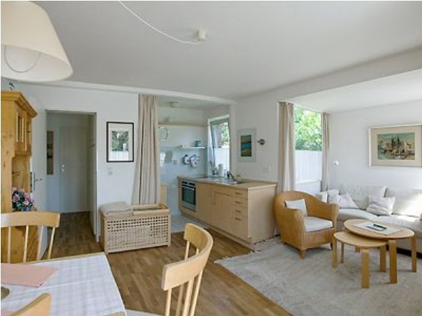
Helles Wohnzimmer mit Küchenzeile