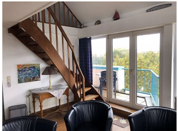
Wohn-Essbereich untere Etage