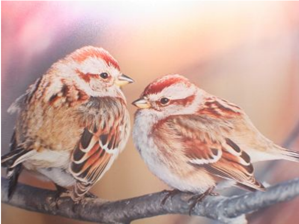
Spatzennest in Cuxhaven Döse - strandnah