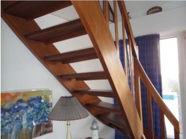
Treppe zur Galerie