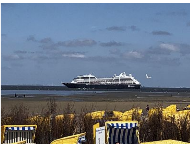
Blick auf die Elbmündung