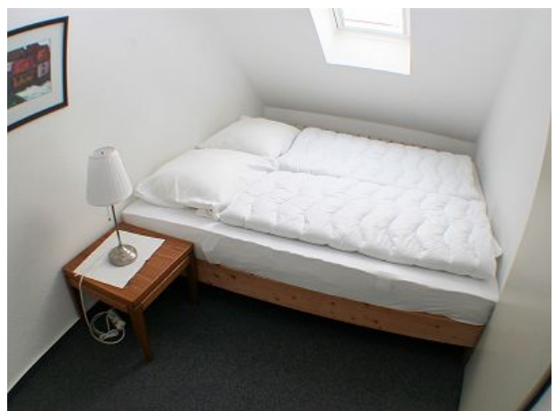
Oberes Schlafzimmer mit Doppelbett