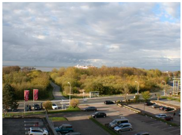
Blick aus der Wohnung