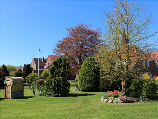
Garten Grillen Strandkorb