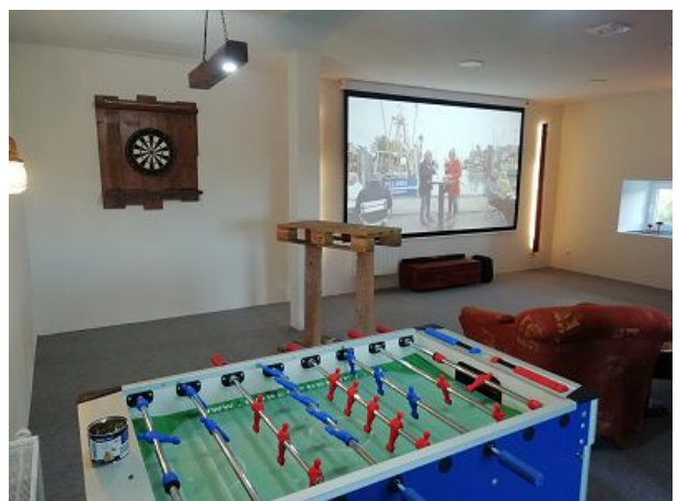
Hof Bar nur für Erwachsene