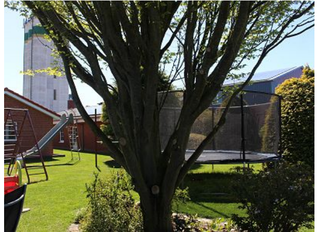
Garten mit Spielplatz