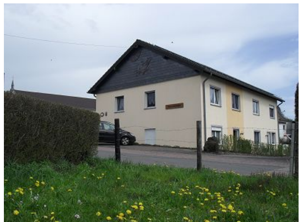
Ferienhaus mit vier Wohnungen