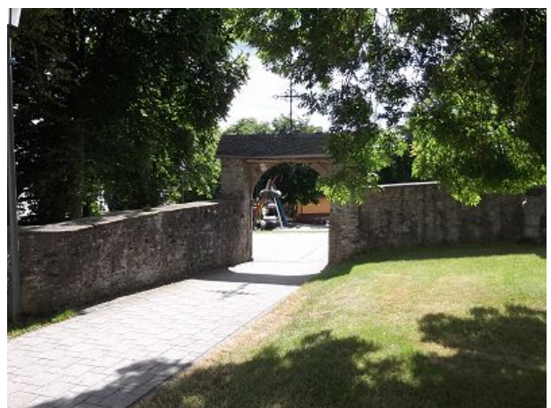
alte Kirchenmauer und Dorfbrunnen