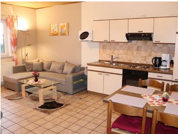
viel Platz in der Wohnküche