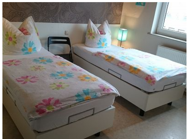
Bett zusammen oder einzeln stellbar