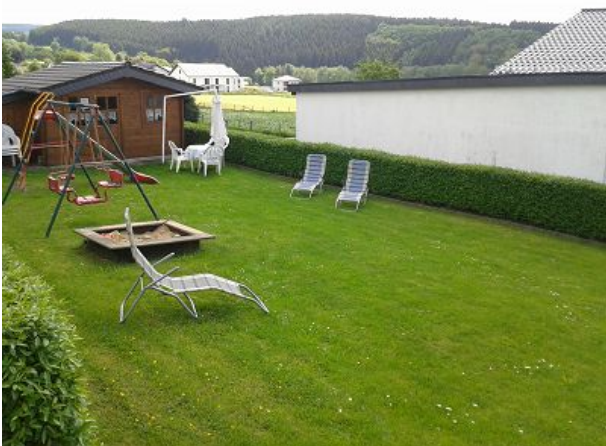
relaxen oder spielen im Garten