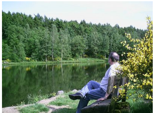
entspannen am Angelteich Bleialf