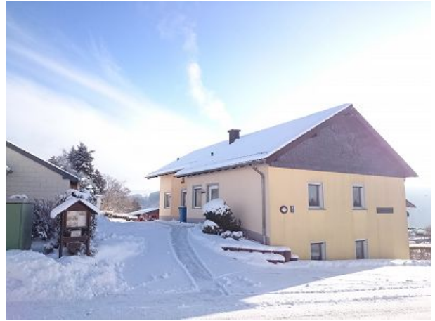
Auch im Winter eine Reise wert