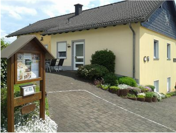
Willkommen im Ferienhaus Gönen