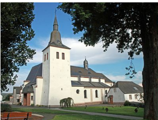
Kirche mit alten Deckenmalereien