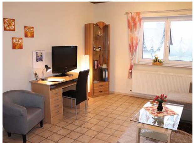
zusätzliche Schreib- und Lesecke