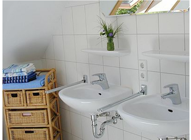
helles und freundliches Bad