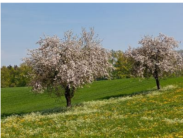
Frühling auf dem Bauernhof