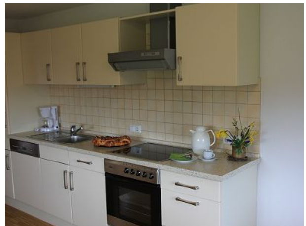
gut eingerichtete Küchenzeile