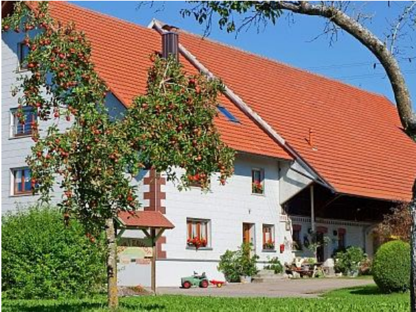
Ferienhof Uebelhör im Allgäu