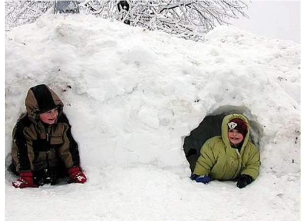
Kinderglück im Winter