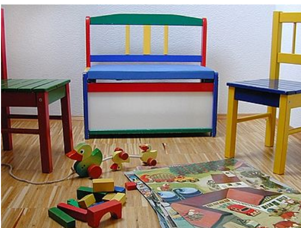
Spielecke für die Kleinen