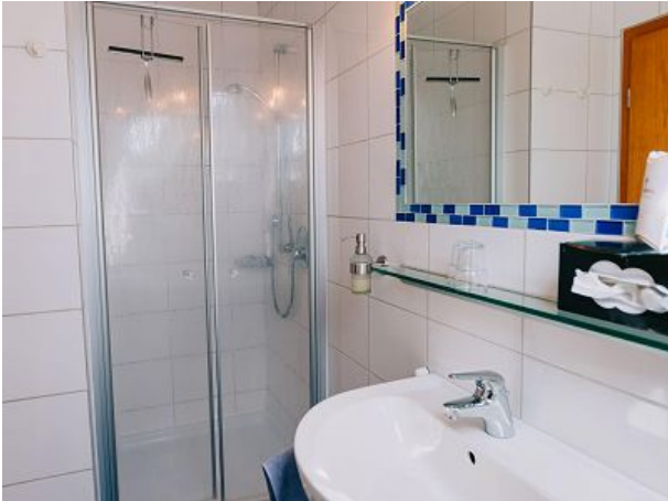
Badezimmer mit Dusche und WC