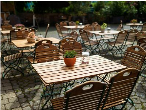
im mediterranen Hof