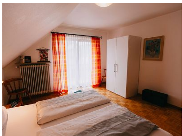
Schlafzimmer mit Zugang auf den Balkon