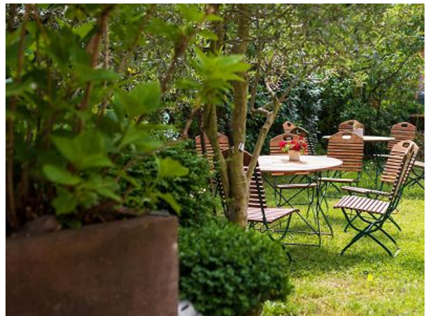
oder im Garten