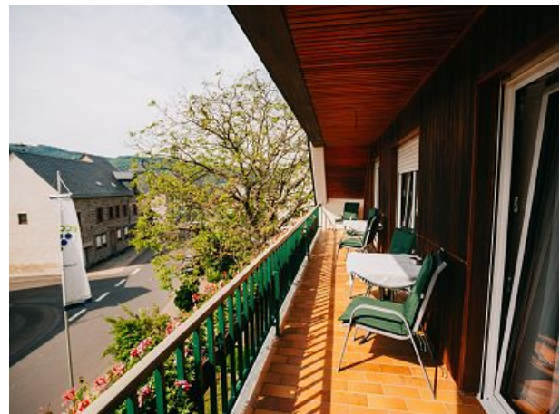
Großer Balkon der Tango und Polka