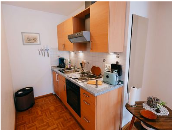
Voll ausgestattete Küchenzeile