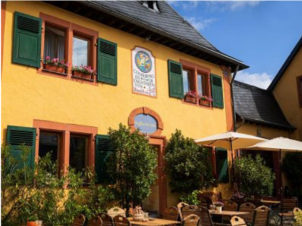
Eingangsberich des Haupthauses