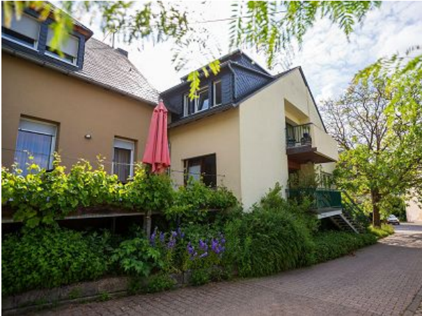
oder mit einer Gästeterrasse