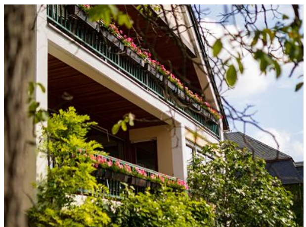
mit großem sonnigen Gästebalkon