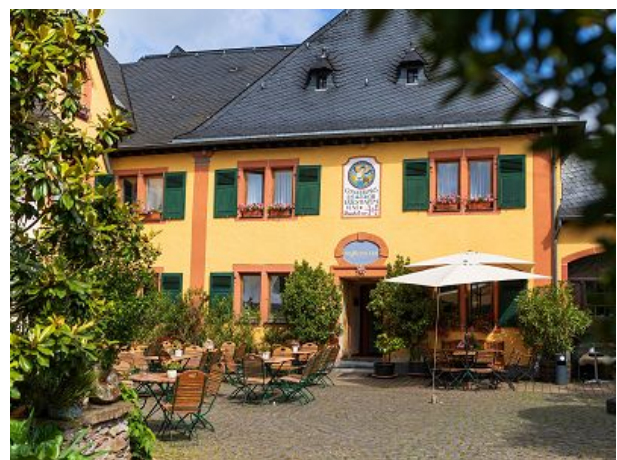
Bio-Weingut Staffelter Hof