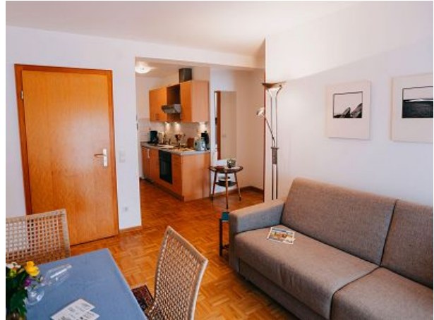
Offener Wohn-Essbereich mit Küchenzeile