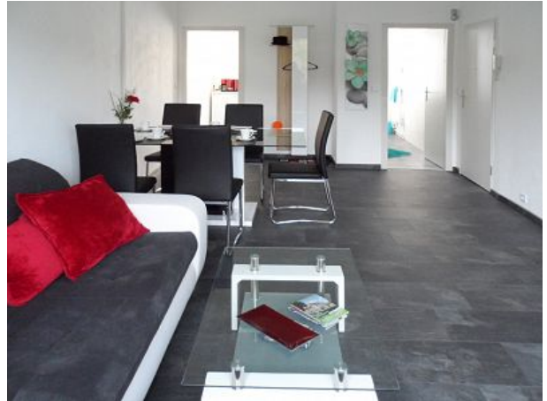
Blick vom Fenster ins Wohnzimmer