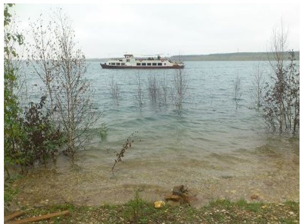
Fahrgastschiff Santa Babara