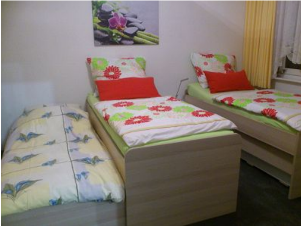
Betten können getrennt gestellt werden