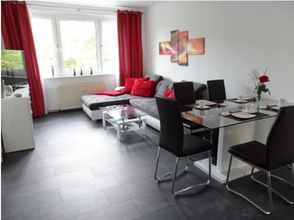
Wohnzimmer mit TV