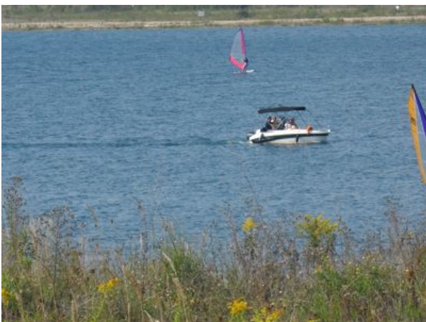
Motorboot zum Leihen ohne Führerschein