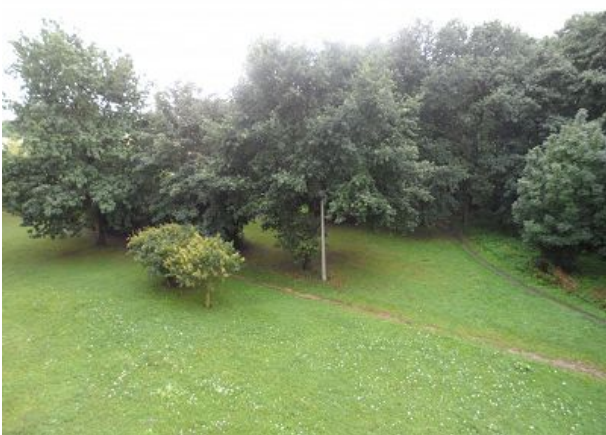
Blick aus Fenster