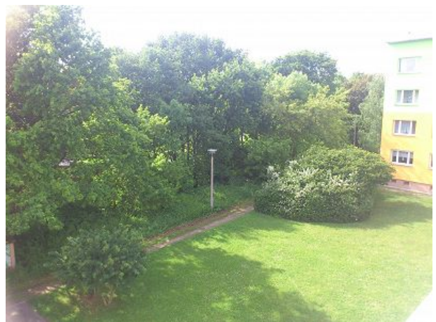
Blick aus Fenster