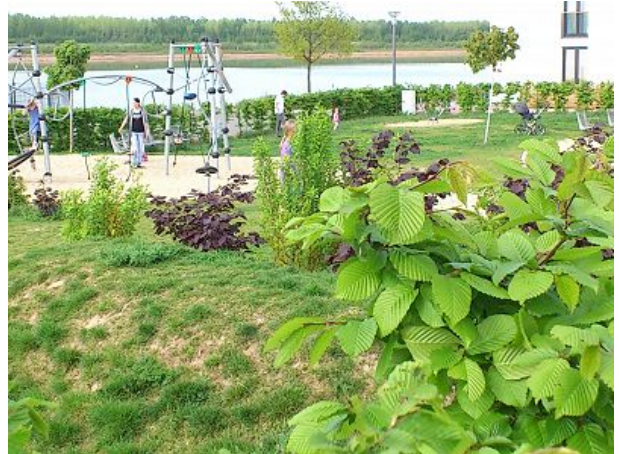
Spielplatz in Hafennähe