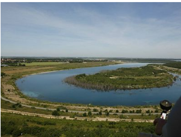
Fahrradweg am See