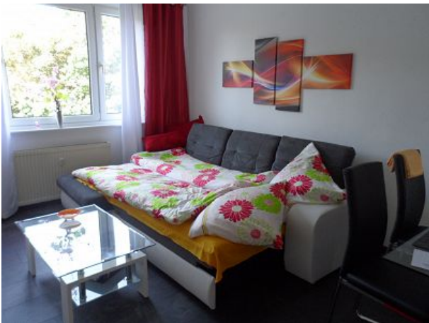
Schlafsofa im Wohnzimmer