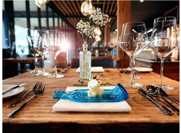
Dinner im Restaurant Isfjord