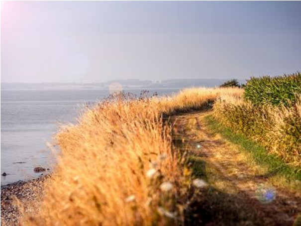
Wanderweg im Naturpark