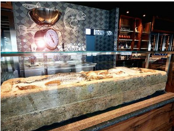
Trog mit Fangfrischem Fisch