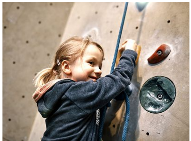
Kletterturm im Funhalla