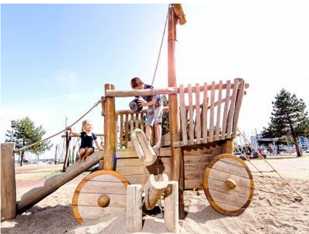
Spielplatz im Wikingerstil