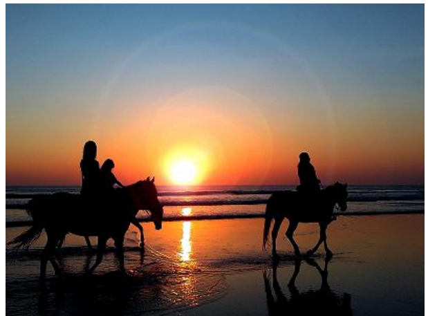
Reiten im Sonnenaufgang