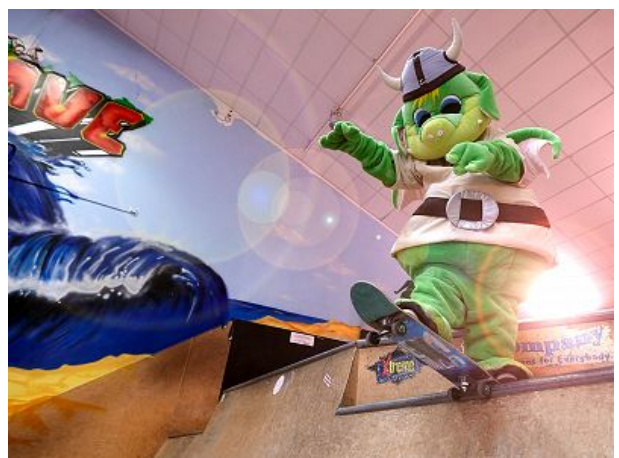
Leif auf Skaterbahn im Funhalla