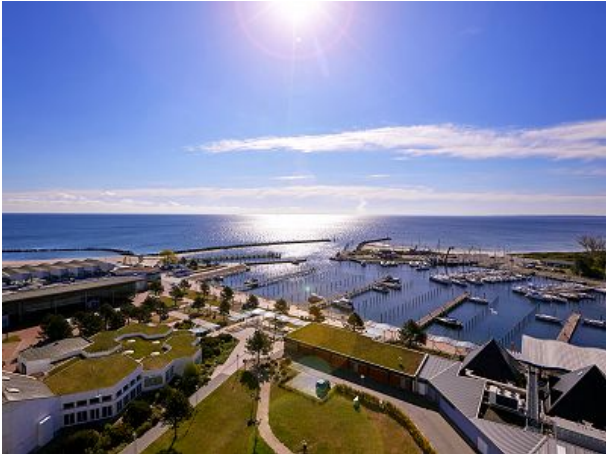
Aussicht aus dem Ostseehotel Midgard