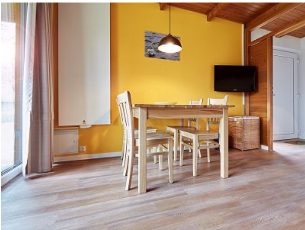
Offene Essecke mit Fernseher