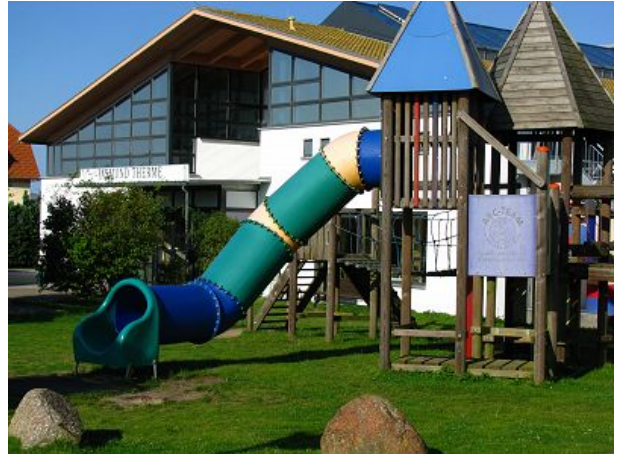
Erlebnisbad mit Kinderspielplatz