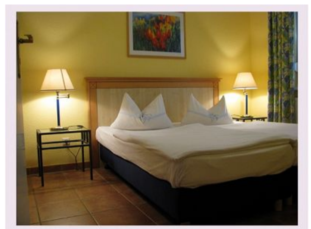
Schlafzimmer mit großem Kleiderschrank