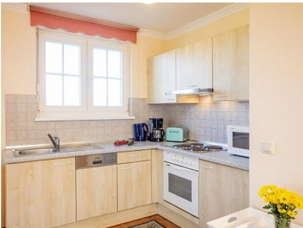
Komplett eingerichtete Küche