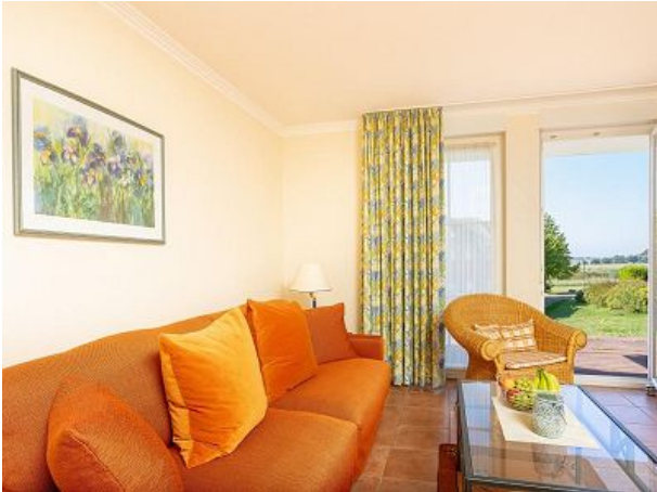
Wohnzimmer mit Bettsofa