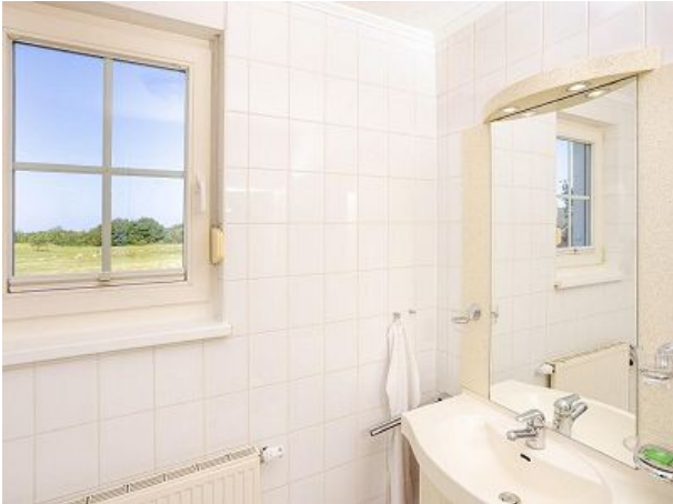
Badezimmer mit Dusche und WC