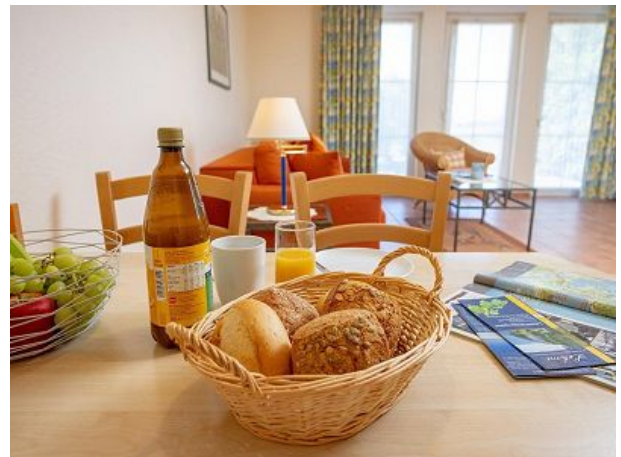
Essbereich für vier Personen