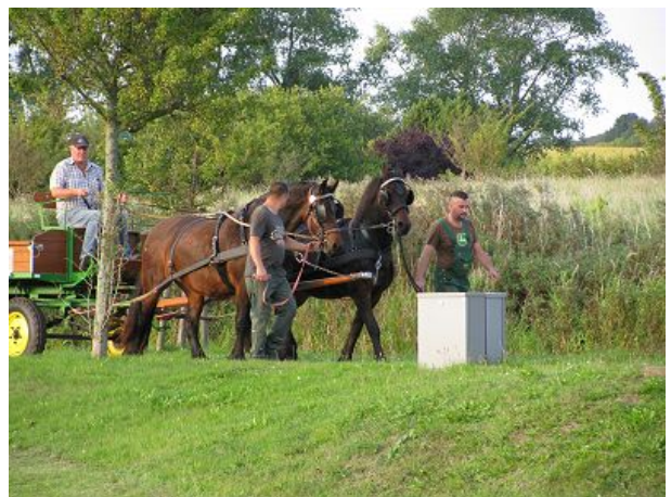
Pferdekutsche im Precise Resort