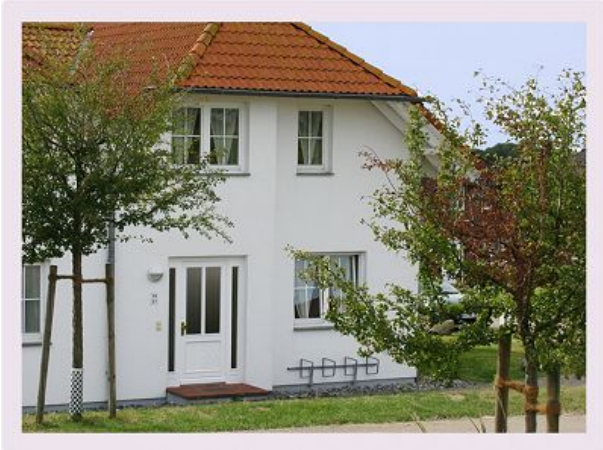
Aussenansicht - Eingangsbereich