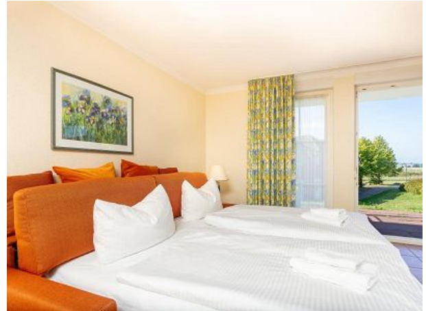
Bettsofa - Relax Rückenlift-Bed Box Abta