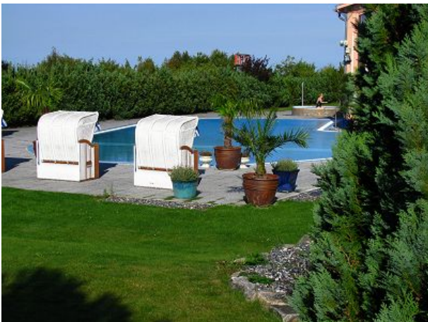
Erlebnisbad mit Aussenpool