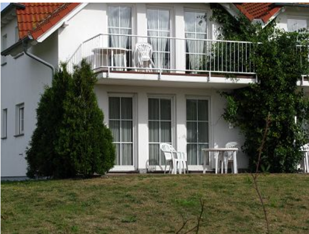
Aussenansicht - Terrasse