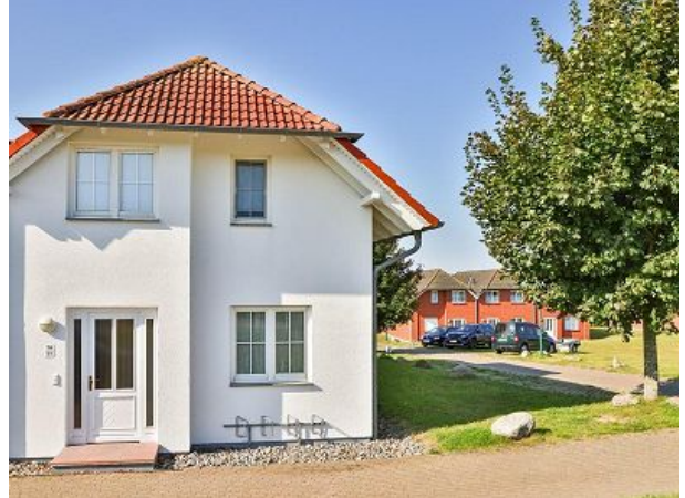
Aussenansicht mit Pkw-Parkplatz