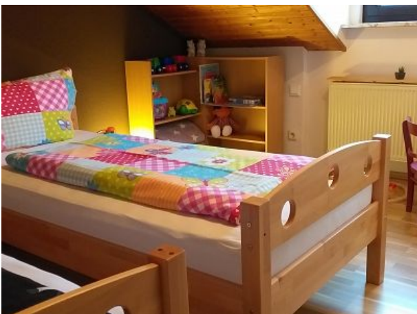
auch als Kinderzimmer und zum spielen