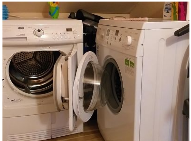
waschen und trocknen in der Fw