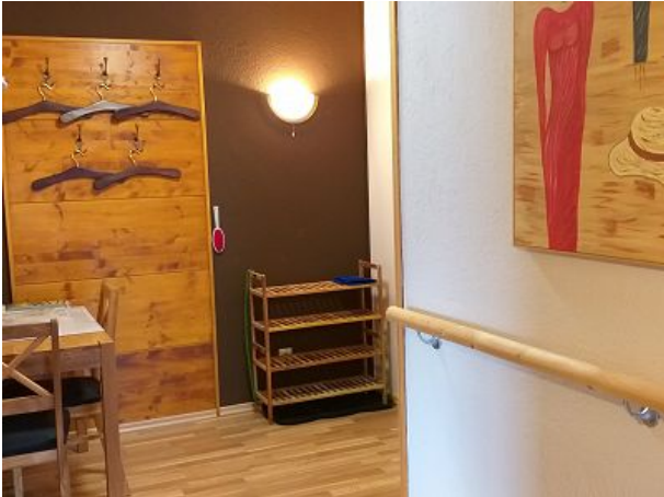
Diele mit Schreibtisch