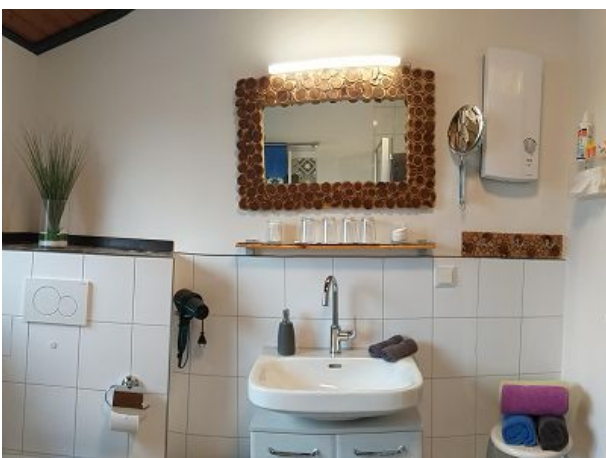
modernes Tageslichtbad mit Fenster