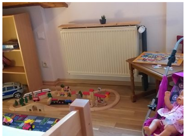
Spielecke im Kinderzimmer