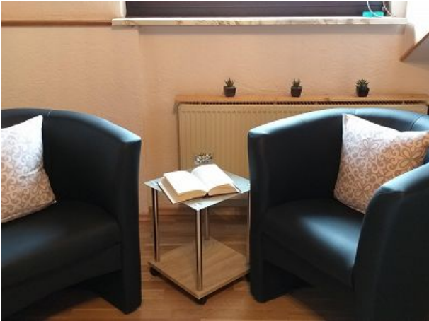
Gemütliche Leseecke im Schlafzimmer