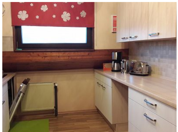
Küche mit Spülmaschine