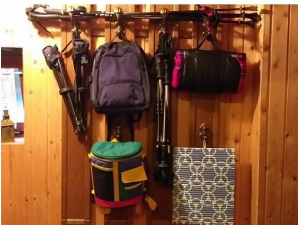
Wanderausrüstung zur Ausleihe