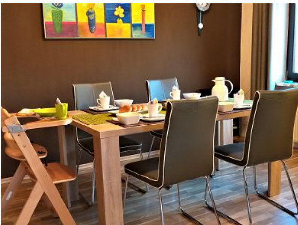
frühstücken und genießen