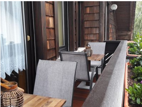
Sonnenuntergänge vom Balkon genießen