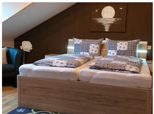
Schlafzimmer mit Platz für ein Reisebett