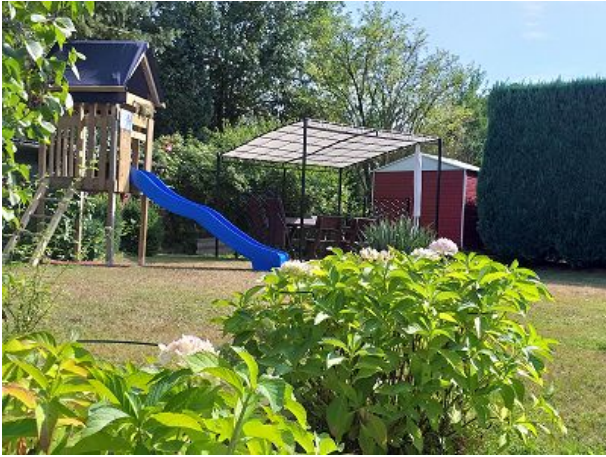
Spielwiese Kletterturm Grillplatz