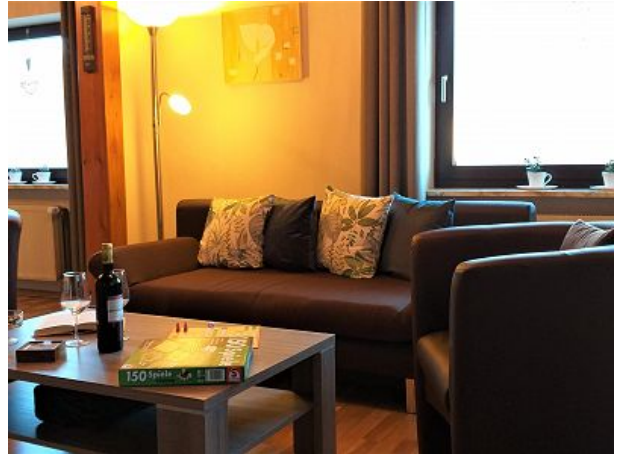
Unser gemütliches Wohnzimmer