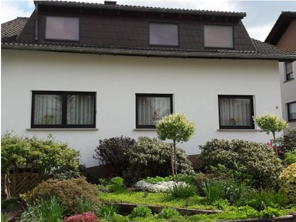
Urlaub pur Apartment am Stadtrand