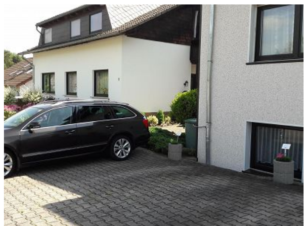
Sie parken Ihren Pkw direkt vorm Haus