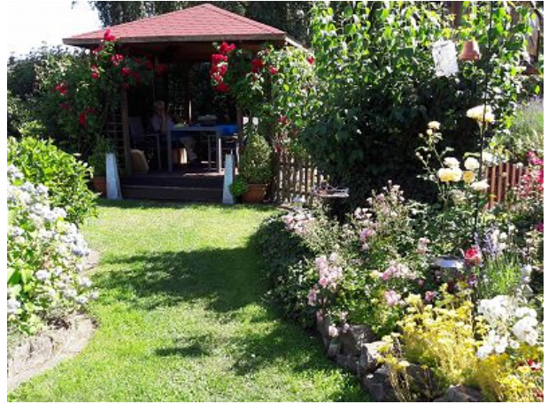
Unser Rosenpavillion im Entdeckergarten