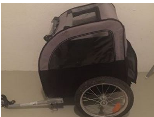
Hundeanhänger für mittelgroße Hunde