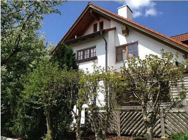
Ferienhaus Bad Buchau