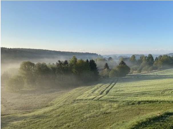
Bad Buchau und Umgebung