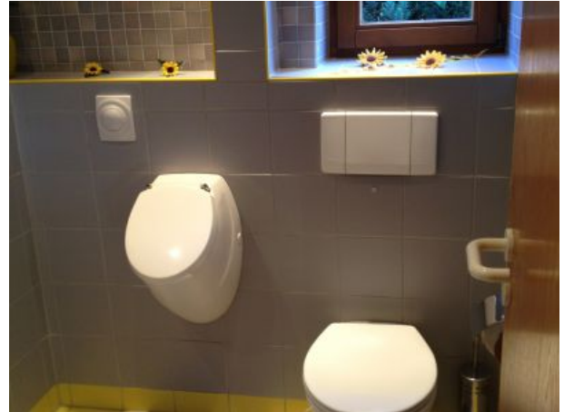
Gästetoilette mit Urinal