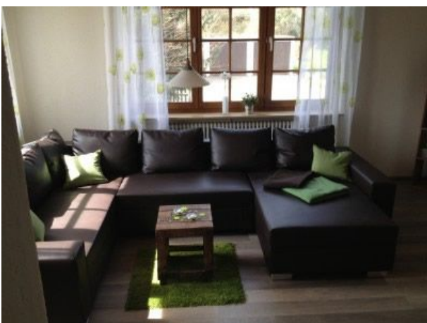
Gemütliches Wohnzimmer mit viel Platz