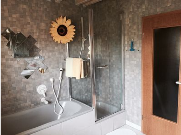
Badezimmer mit separater Wanne