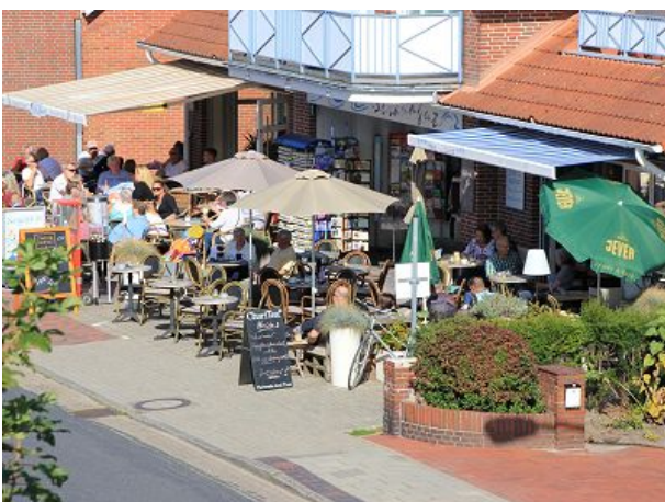
Cafe Zweite Heimat und Eisdiele