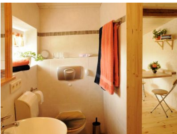
weiteres Bad im ersten Stock