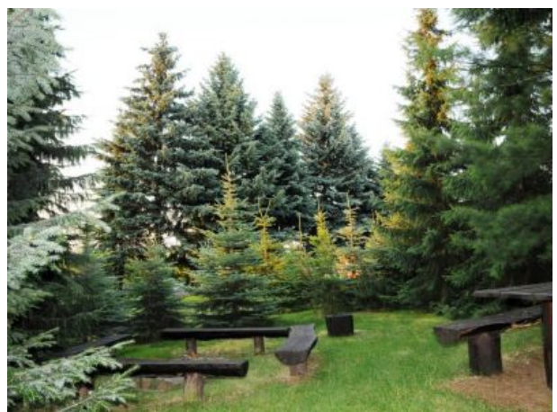
Grillplatz mit Lagerfeuerstelle