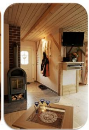
Bad und Eingangsbereich