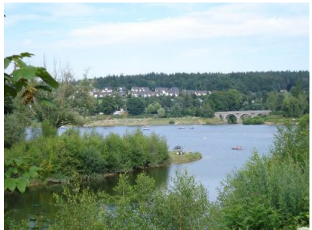
Strandbäder - Talsperre Malter