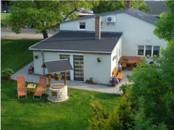
Kaminromantik und Ruhe pur