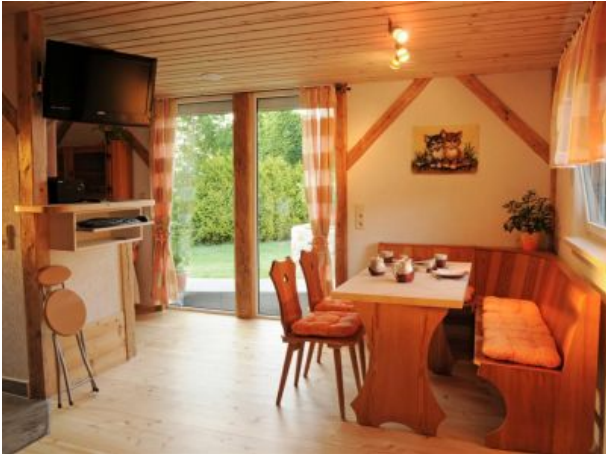
Essbereich mit Blick zum Kamin