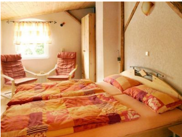
Schlafzimmer im ersten Stock