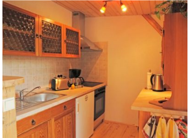
Arbeitsbereich für das Küchenwunder