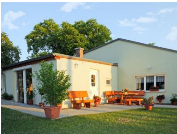
Sitzecke mit Blick ins Grüne