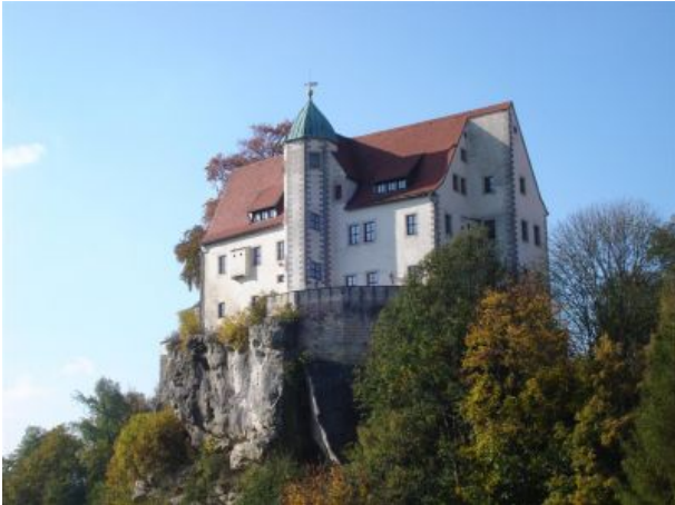
Burg Stolpen - Gräfin Cosel