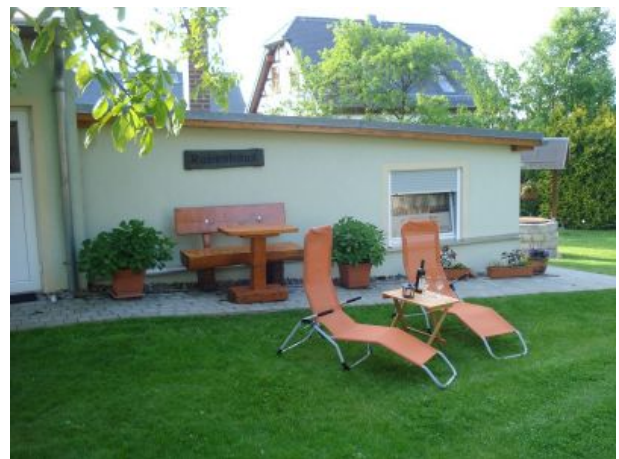
zweiter separater Eingang