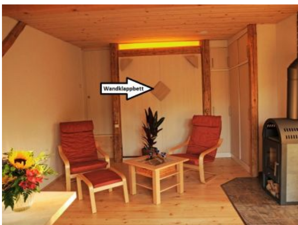
Wohn- und Schlafbereich