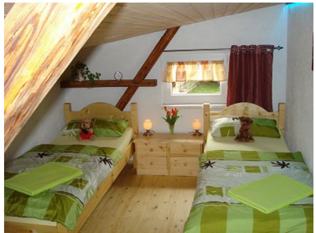
Kinderzimmer vom Schlafzimmer erreichbar