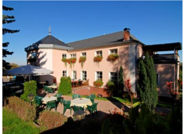
Restaurant Rabennest - Bowling - Kegeln