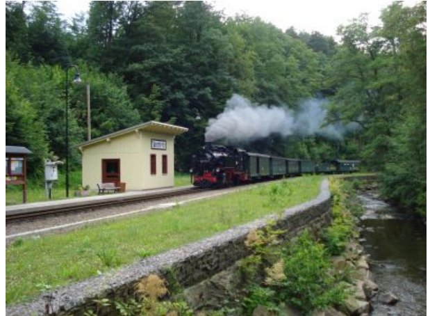
Bimmelbahn durch Rabenauer Grund