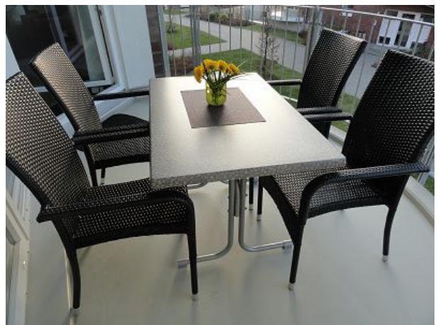
Balkon mit Westausrichtung