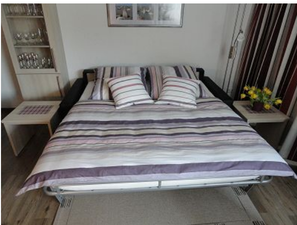
Schlafsofa im Wohnraum