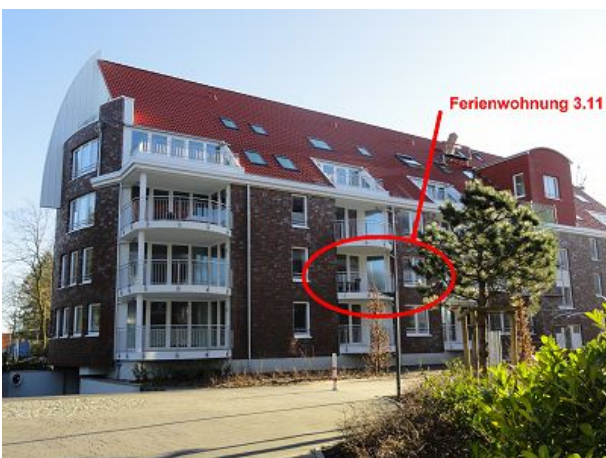
Balkon unserer Wohnung