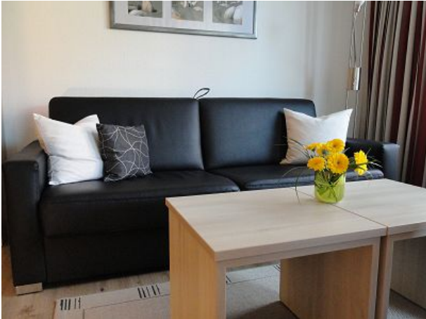
Wohn- und Schlafsofa