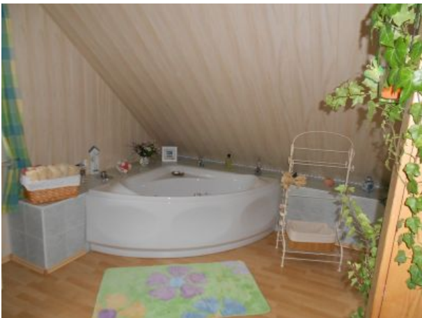
Badezimmer mit Whirlpool