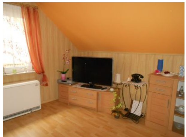
Wohnzimmer mit Fernseher