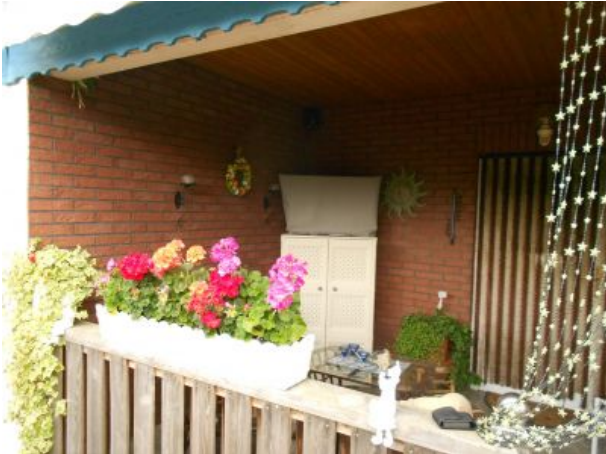
Sitzecke aussen mit Fernseher und Radio