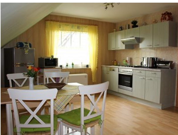
Küche mit Essplatz