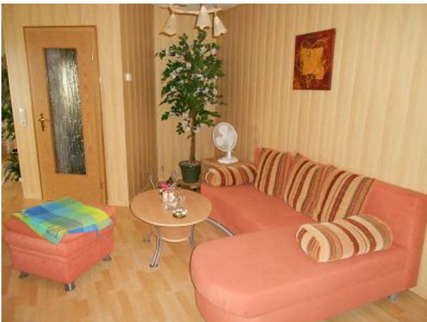
Wohnzimmer mit Couch