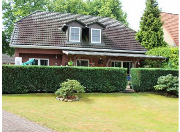
Rückseite Haus und Grundstück