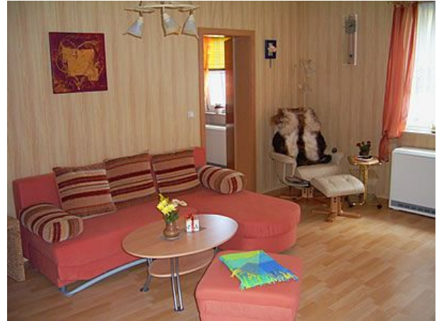
Wohnzimmer mit Massagesessel