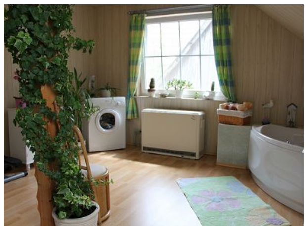
Badezimmer mit Waschmaschine