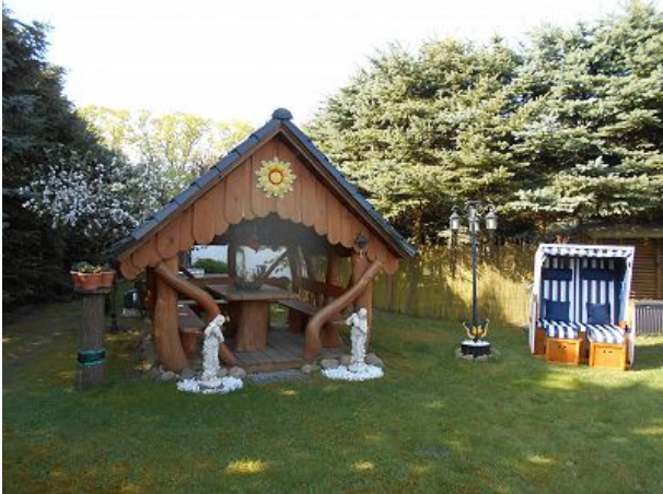
Gartenhaus und Strandkorb