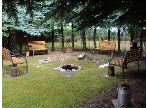
Feuerstelle im Garten