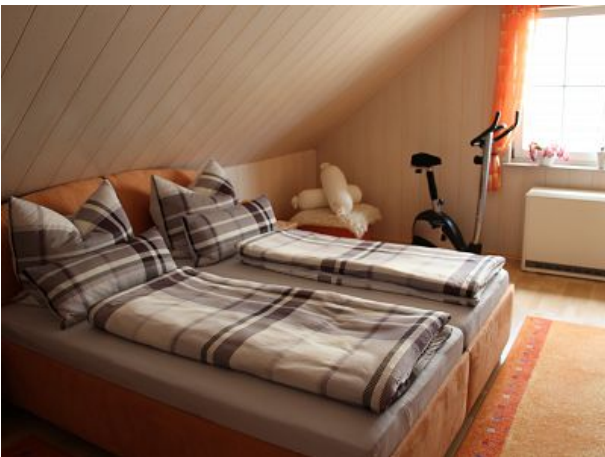
Schlafzimmer mit Heimtrainer