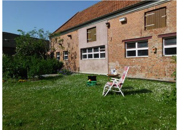
Relaxen wenn das Kind spielt