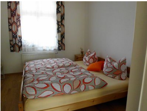
Schlafzimmer FEWO Eins mit Ehebett