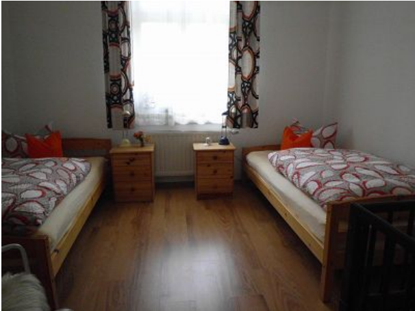
Schlafzimmer FEWO Eins