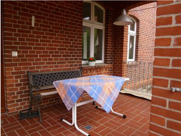
wetterschutzter Sitzplatz am Eingang