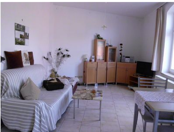
Wohnzimmer FEWO Zwei