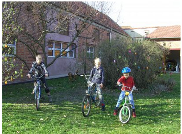
Kinder trainieren auf unseren Rädern