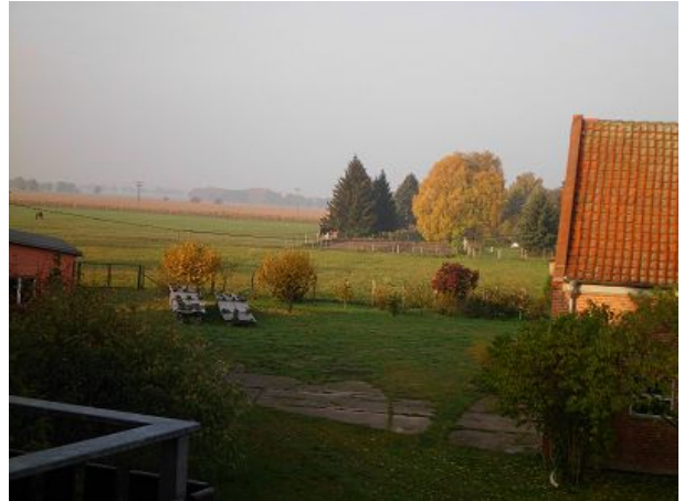
Blick auf den Hof und die Landschaft