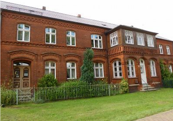
Hausfront vom Rundling gesehen