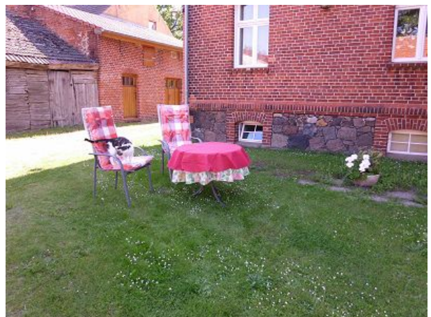
Kater zu Besuch am Essplatz im Hof