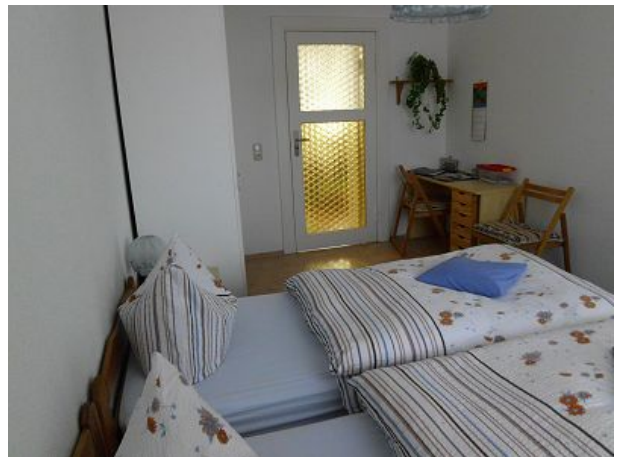
Schlafzimmer FEWO Zwei