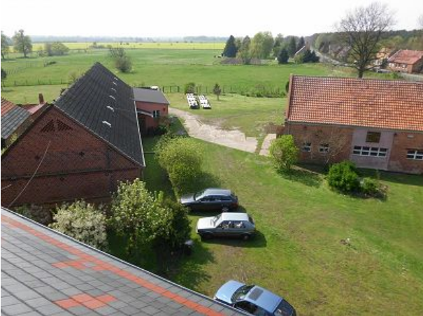
der Hof mit Platz für Autos und Gäste