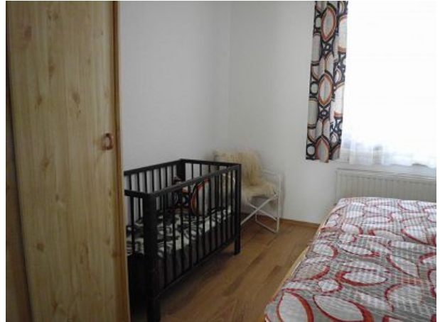
Schlafzimmer FEWO Eins mit Kinderbett