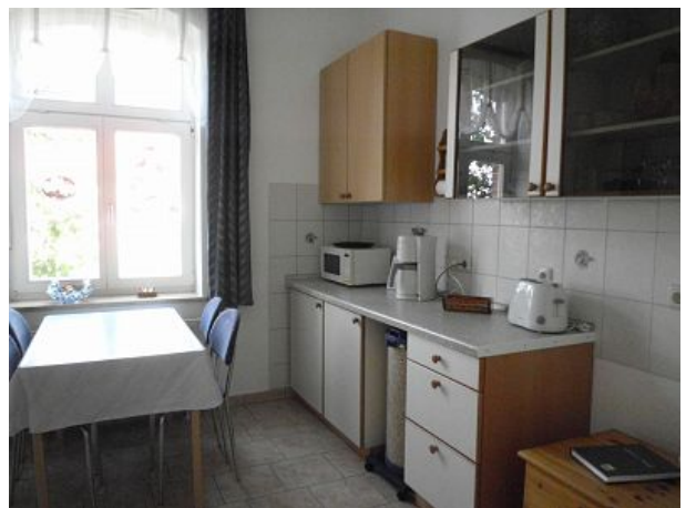
Wohnküche FEWO Eins