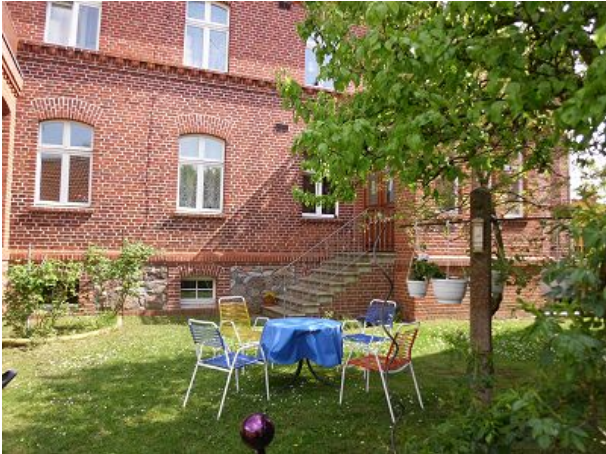
Essplatz unterm Birnbaum