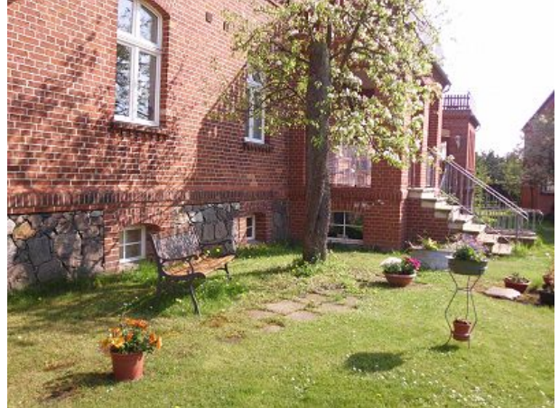
Eingang vom Hof zu Fewos Eins und Vier