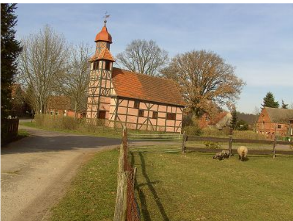
Dorfidylle mit Barock-Kirche