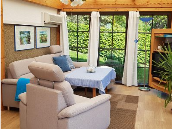
Wintergarten mit Klimaanlage