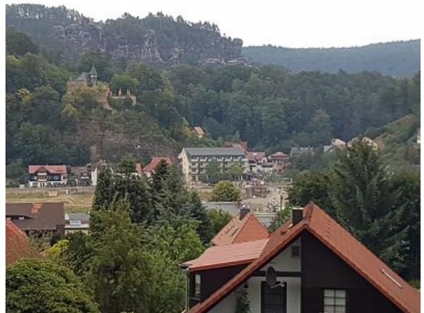
Blick auf Burg Altrathen