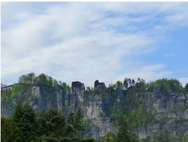
Blick vom Wintergarten auf die Bastei