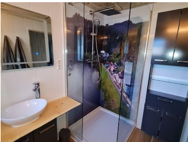
Regenwalddusche und beheizter Spiegel