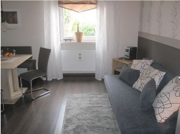
Esszimmer mit Schlafcouch