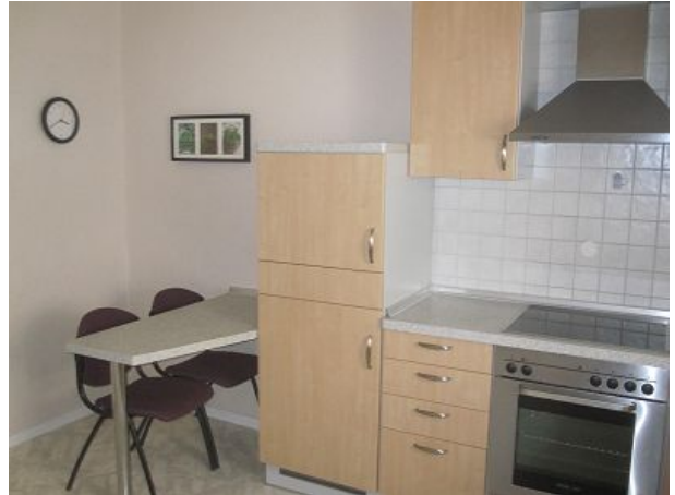
Küche mit Sitzecke