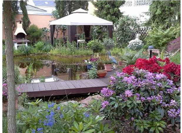
Sitz-Grillecke am Teich im Garten