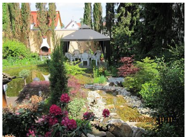
Sitz-Grillecke am Teich