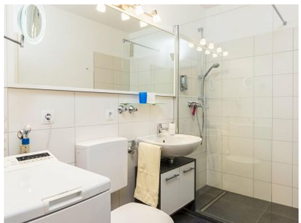
Bad mit Dusche und WC