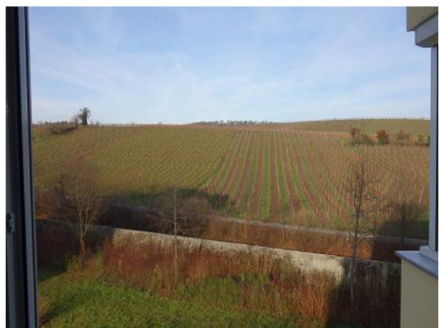
Blick aus der Küche in die Weinberge