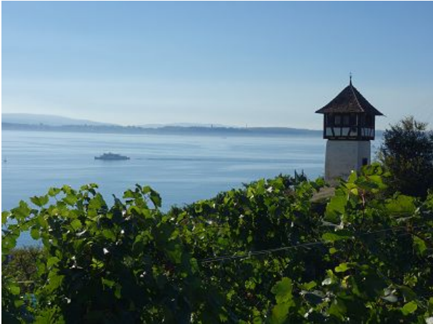
Höhenweg nach Hagnau