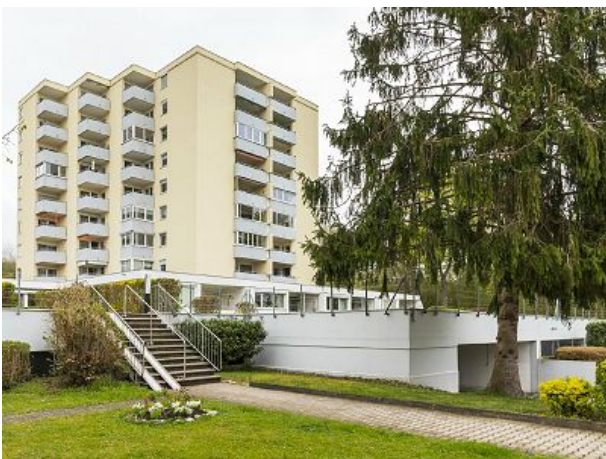
Hausansicht mit Tiefgarageneinfahrt