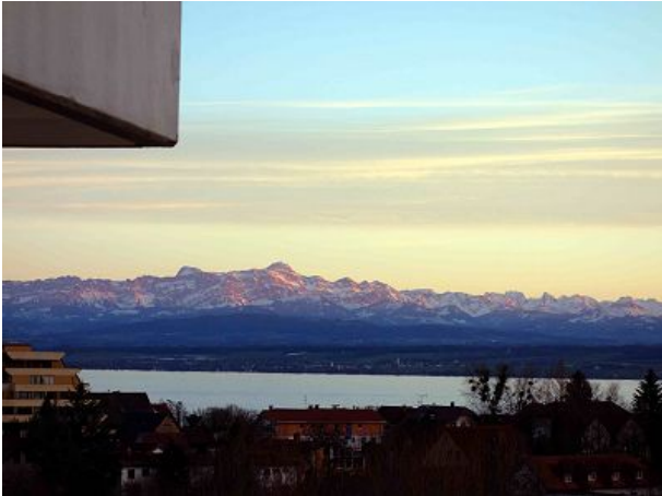
Ausblick vom Balkon