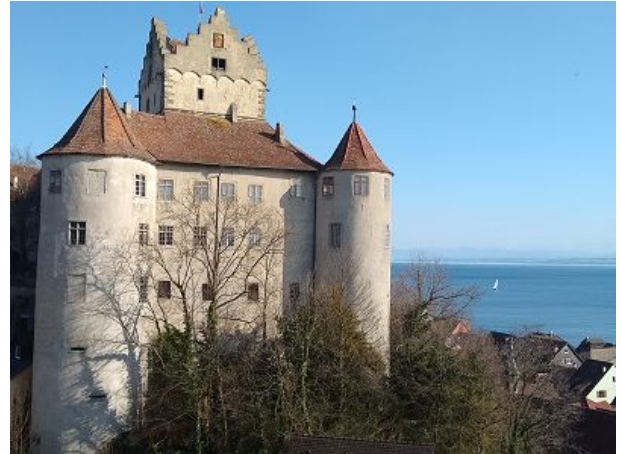
Meersburg Alte Burg