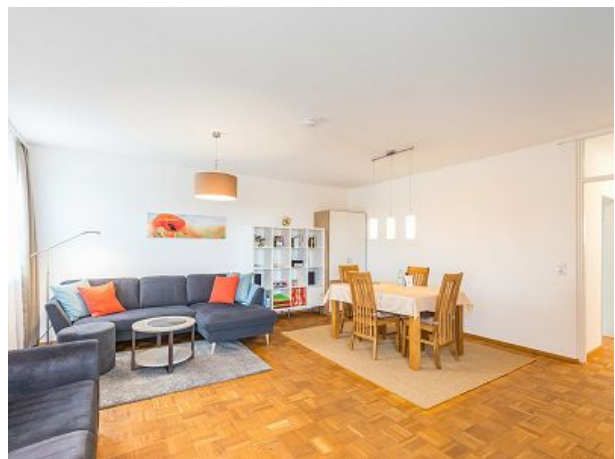
Wohn und Essbereich