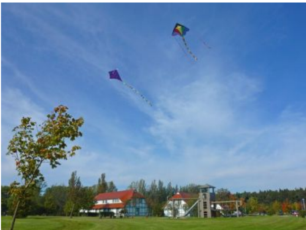
Viel Platz für Alle