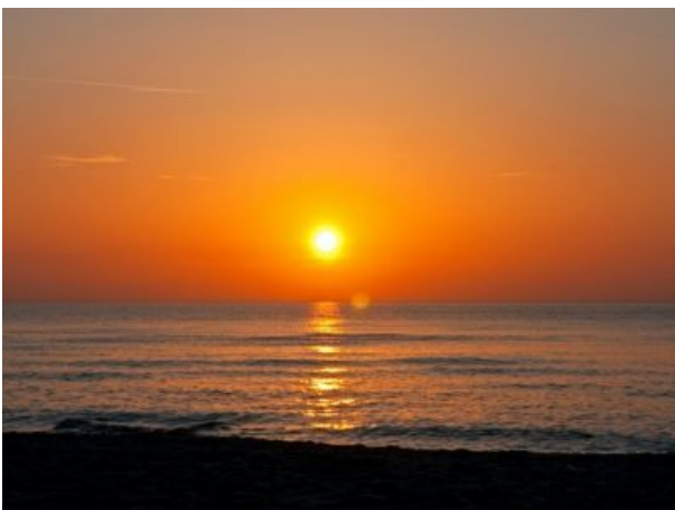
Der nahe Strand