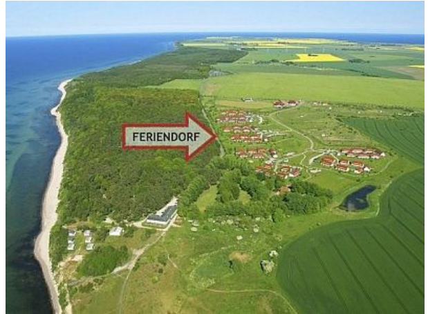
Der Blick von oben