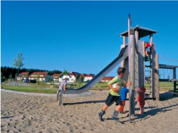
Spielplätze für die Kleinen