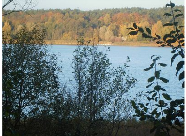
Blick von der anderen Seeseite