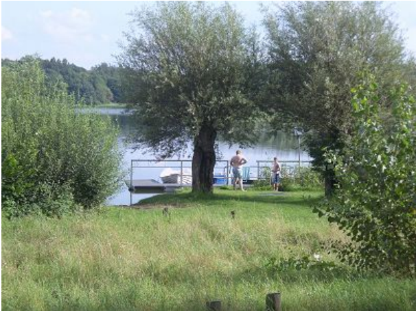
Liegewiese am See