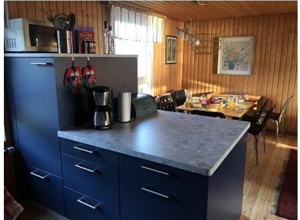
Küchenblock und Essplatz