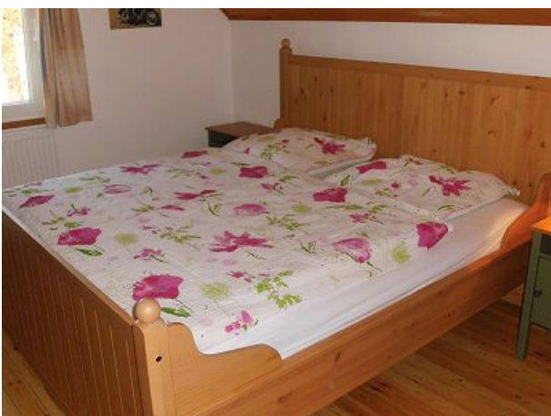
Schlafzimmer oben mit Doppelbett