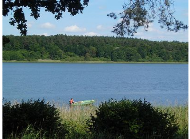
Das ist die Aussicht