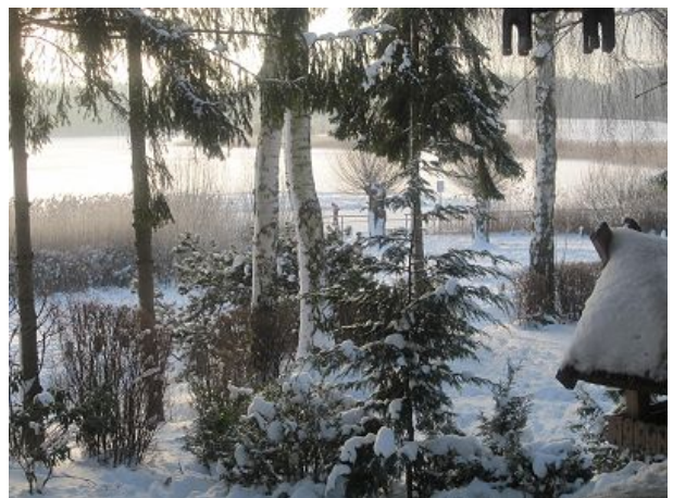
selbst im Winter ein Traum