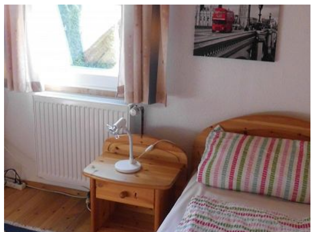
Schlafzimmer oben mit Einzelbetten