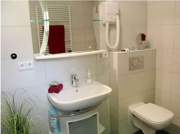
Badezimmer mit Walk-In-Dusche