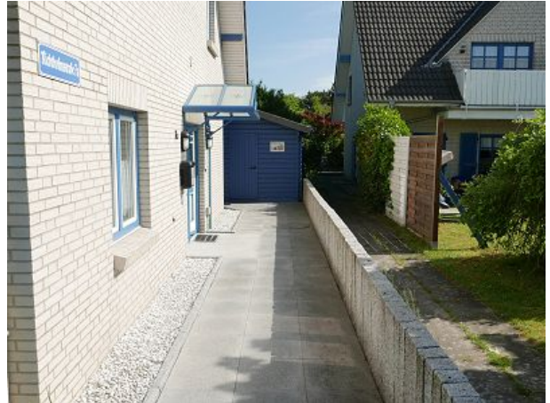
Aufgang zum Haus