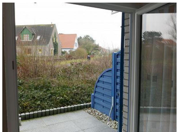
Blick vom Essplatz auf die Südterrasse