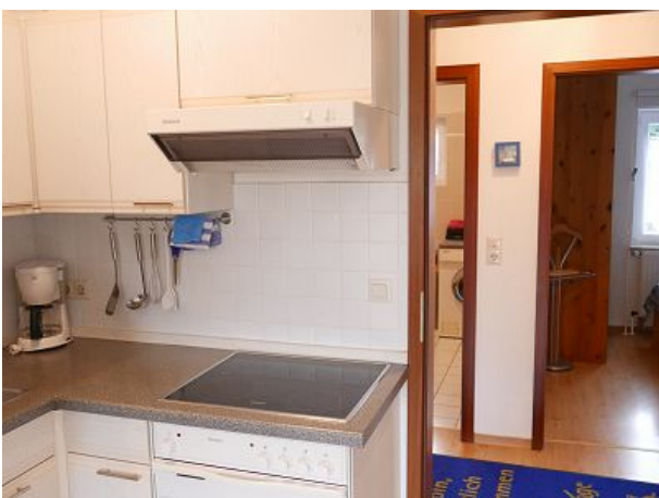
Küche mit Blick in den Flurbereich