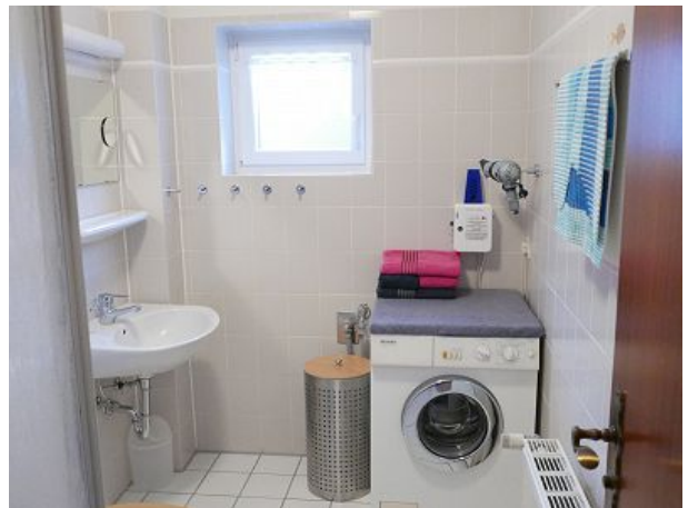
Bad mit Waschmaschine