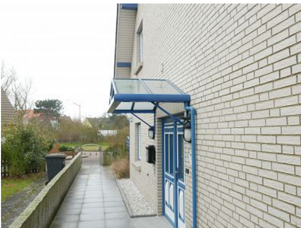
Aufgang zum Haus