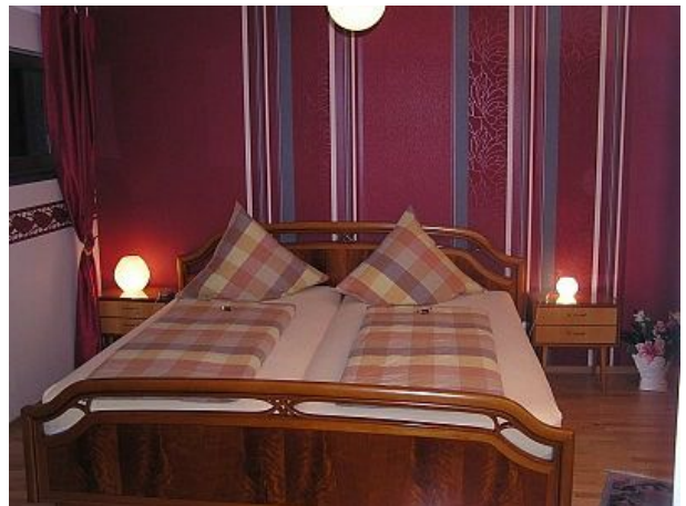
Sz mit TV und elektr verstellbaren Bette