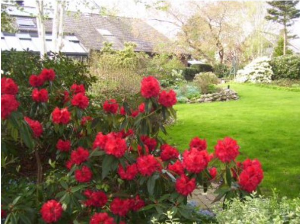
der Garten mit vielen lauschigen Plätzen