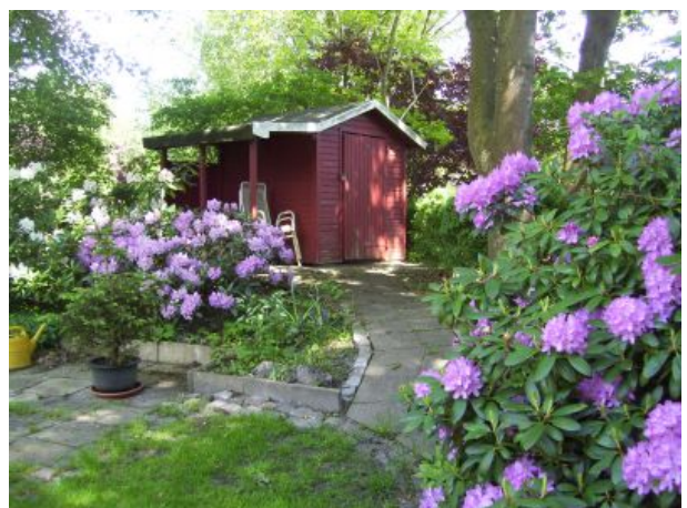
Verwunschene Ecken im Garten