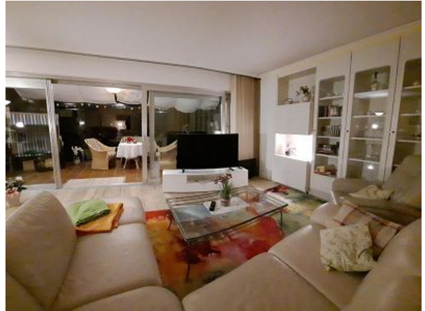
ein neuer großer Flachbildfernseher