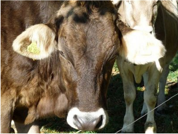
schöne Allgäuer Kühe