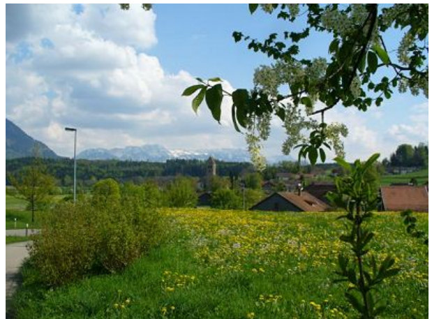
Blick von Stein auf die Berge