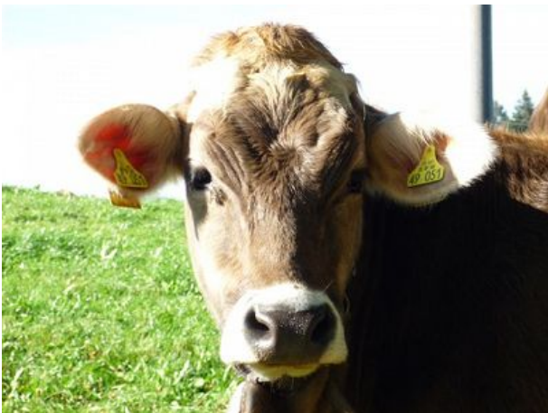
bin ich nicht schön