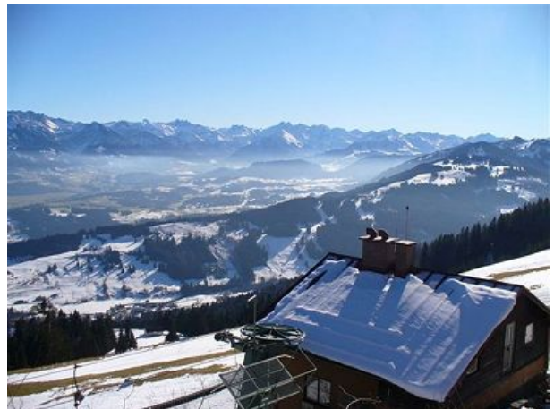
Blick vom Mittag