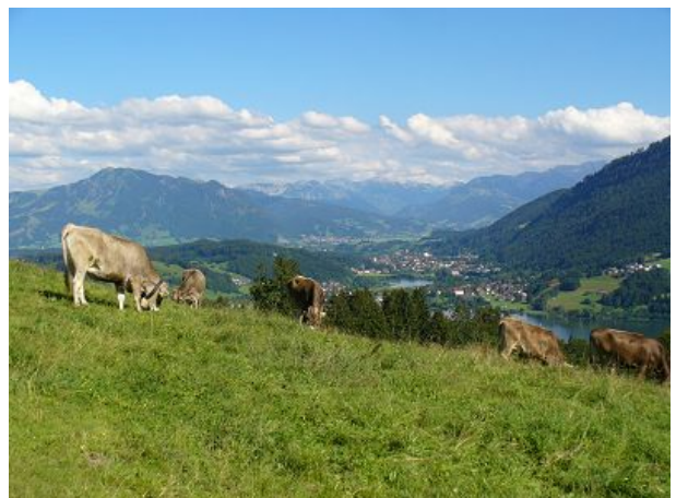
Blick auf den Alpsee