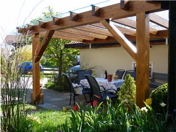
für gemütliche Stunden