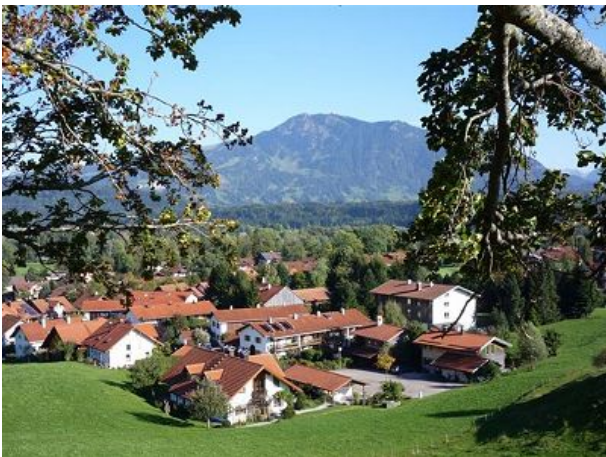
Stein im Sommer