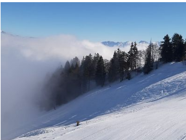
Winter - toll