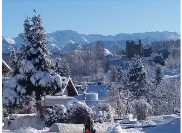
Stein im Winter