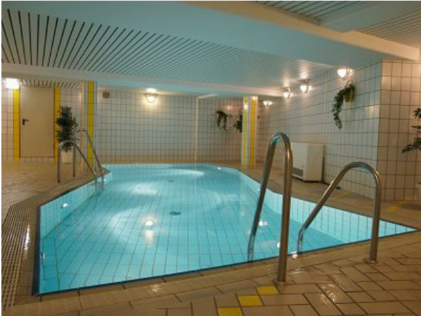
Schwimmbad mit Gegenströmungsanlage