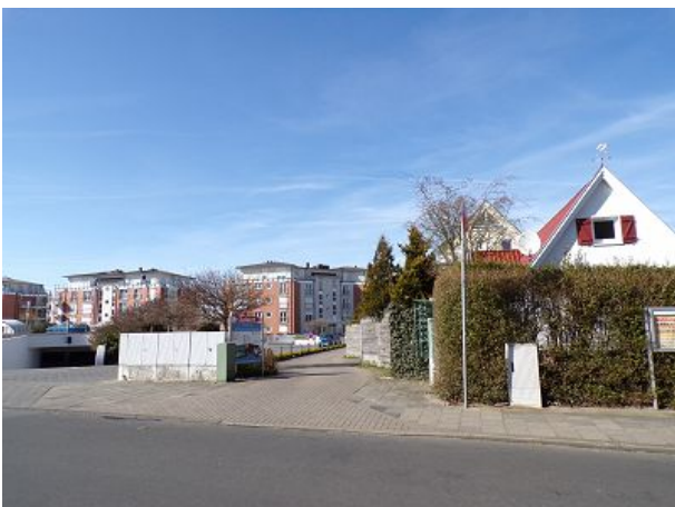
Einfahrt zur Residenz Meeresbrandung