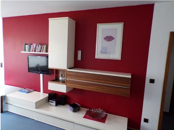
Wohnwand mit Farb - TV