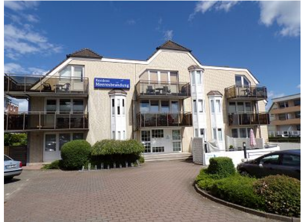
Residenz Meeresbrandung Haus II