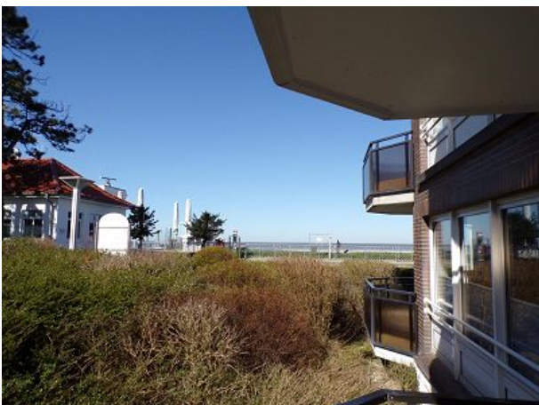
Blick zum Meer