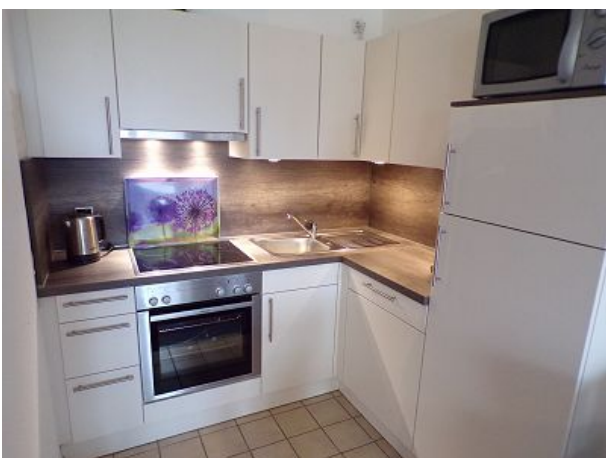
Einbauküche mit Geschirrspüler