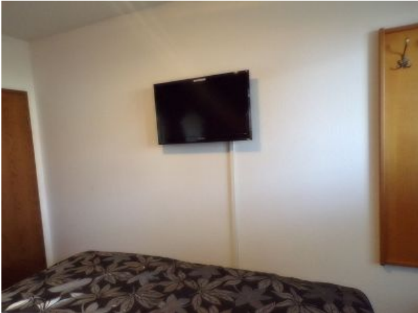
Fernsehen im Schlafzimmer