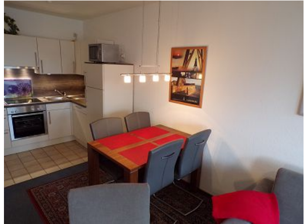
Essecke mit Einbauküche