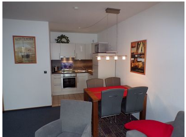
Küche mit allen Utensilien