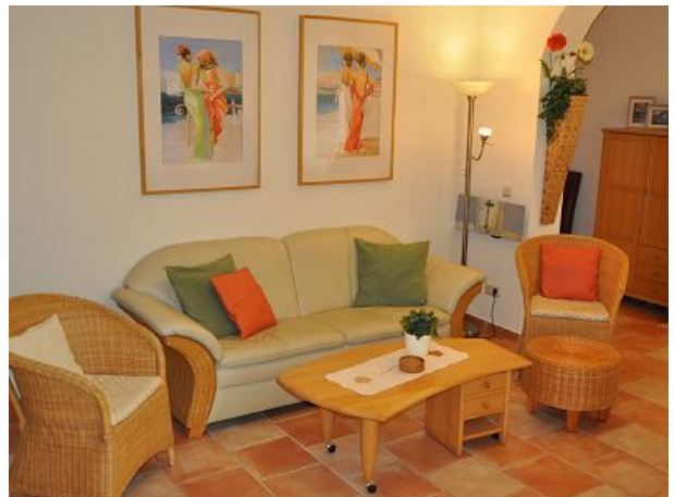
Wohnzimmer mit Kaminofen