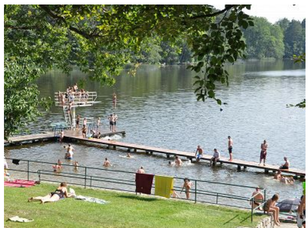
Strandbad mit Sprungturm