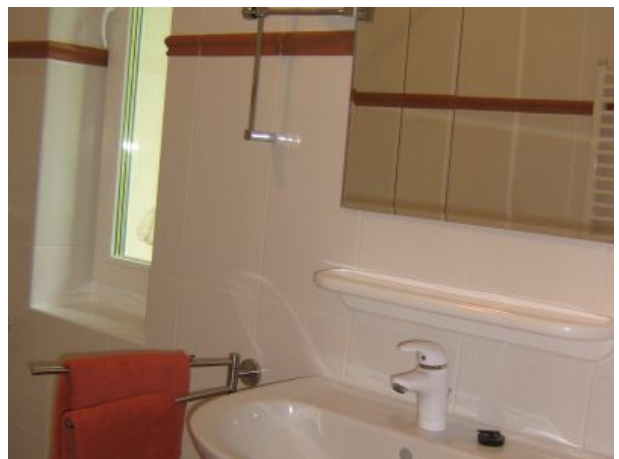
Großes Bad mit ebenerdiger Dusche