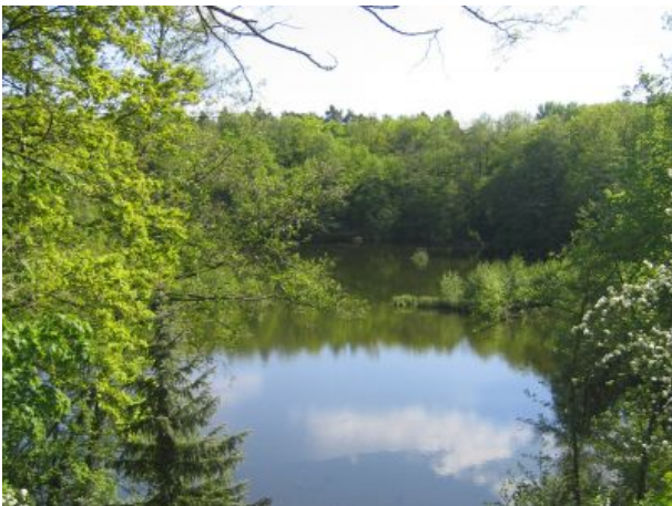
Seele baumeln lassen