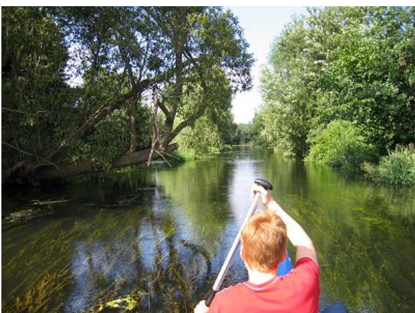
Kanutour über die Alte Oder