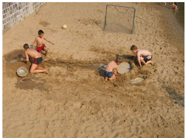
Buddeln am Strandbad