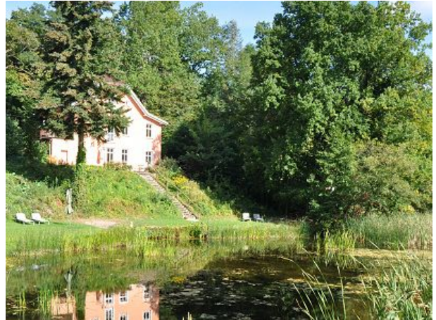
Treppe zur Liegewiese