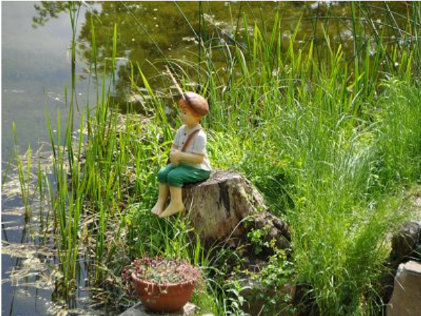
Anglerjunge auf grossem Fang