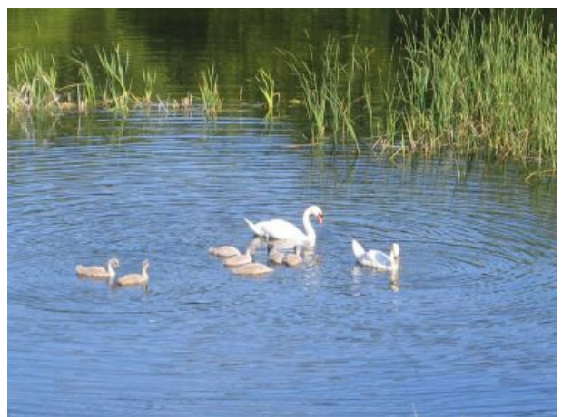
Unsere hauseigene Schwanenfamilie