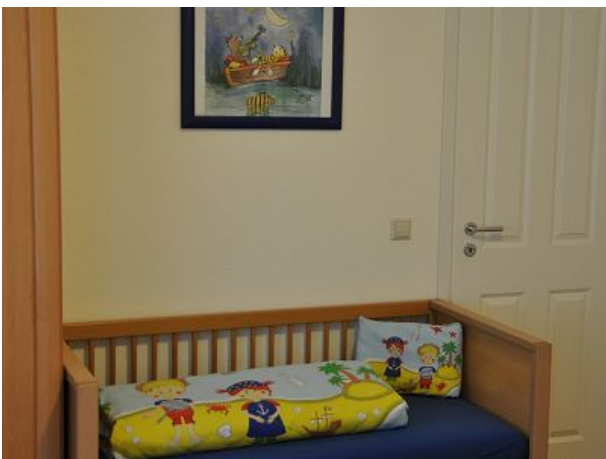
Kinderbett im Elternzimmer