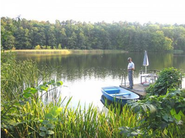
Petriheil an allen umliegenden Seen