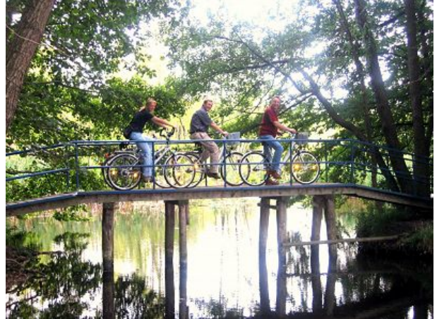
Radeln über Stock und Stein und Brücke