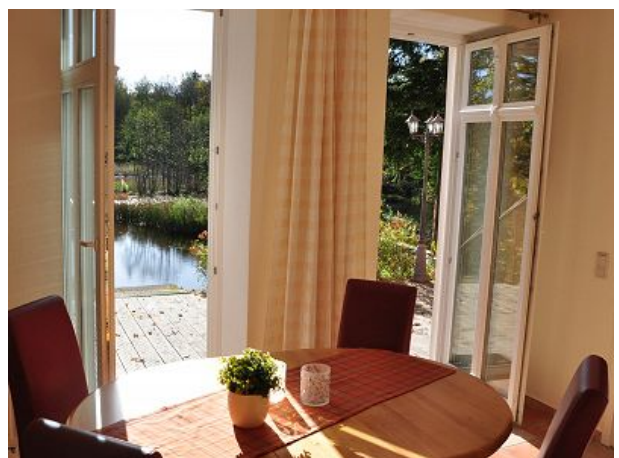
Frühstück mit Besuch der Eisvögel