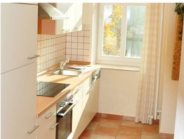
Kühlgefrierkombi Ofen Spülmaschine