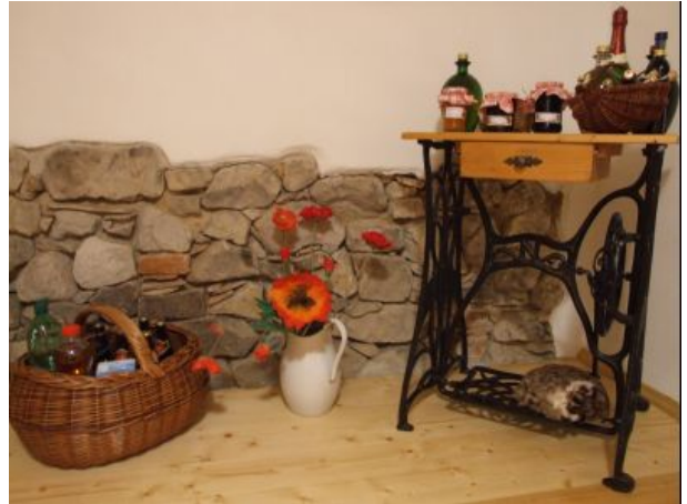
Leckeres vom Land