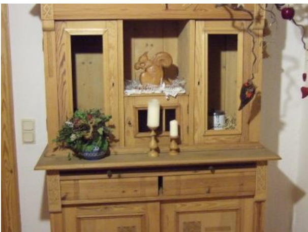
ländliches Ambiente in unserem Haus