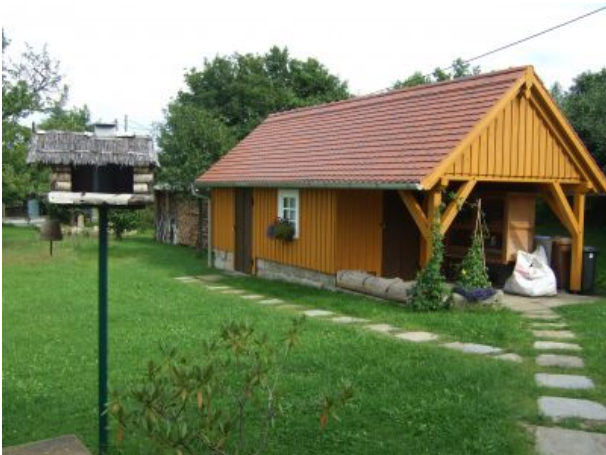
Einstellmöglichkeit für Fahrräder