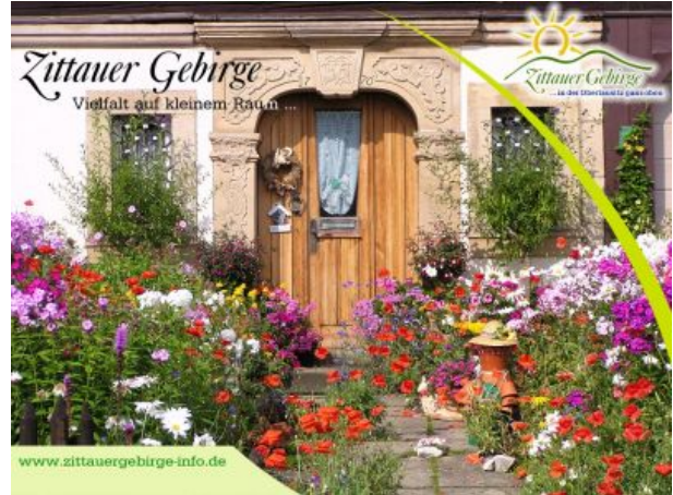
Umgebendehaus in Waltersdorf