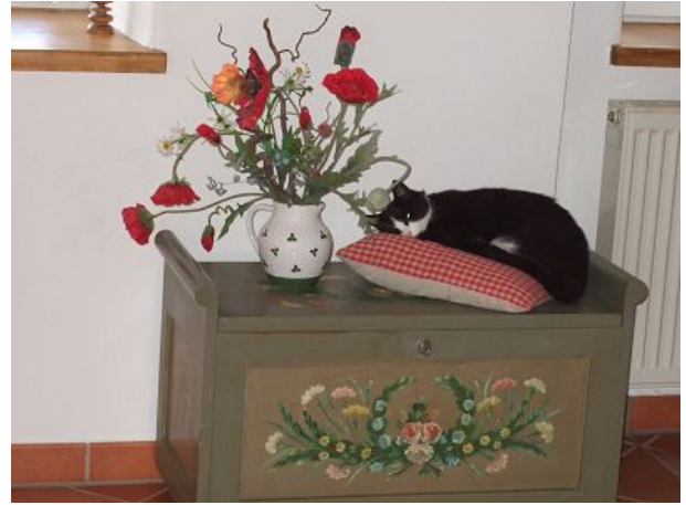
unsere Katze Schnuppel