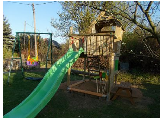
Spielplatz in unserem Garten