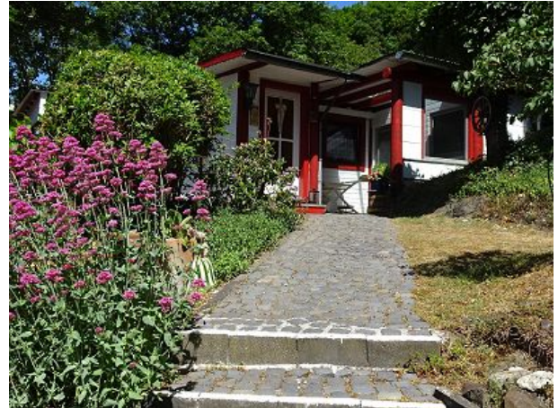
Aufgang zum Haus