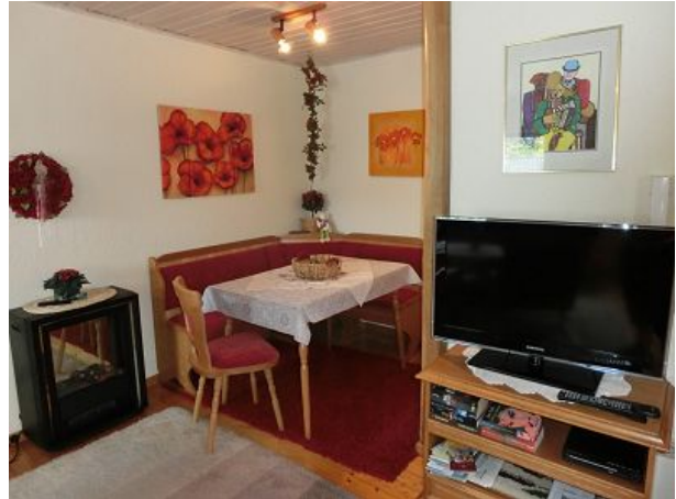
Essecke mit TV