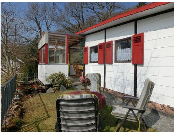
Sonnenterasse mit Wintergarten