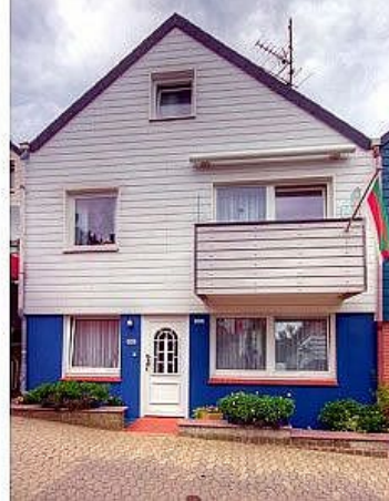
Hauseingang Sellbrunn Helgoland