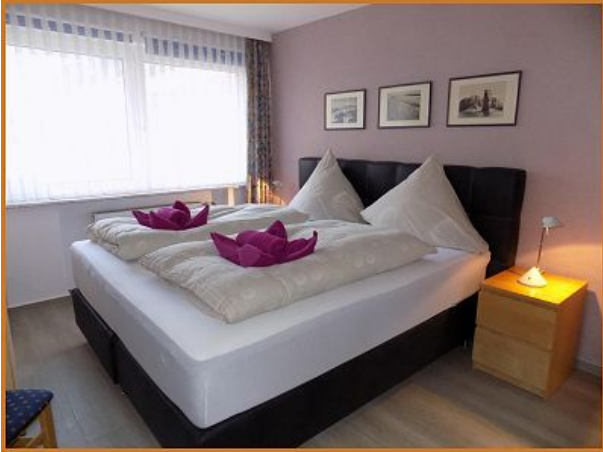
App Sellebrunn Helgoland