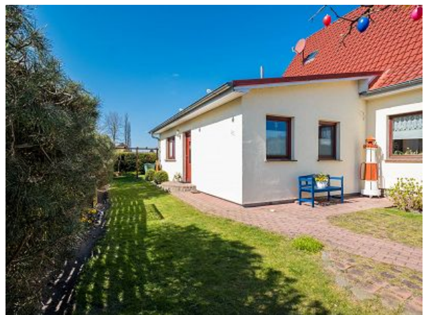
Blick vom Heideweg zum Eingang