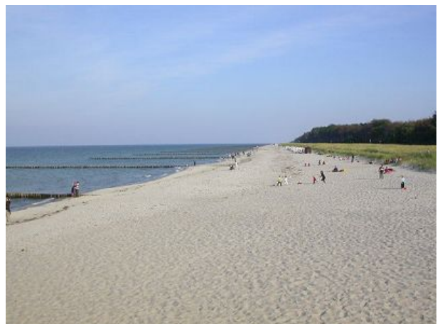
Strandblick Richtung Osten