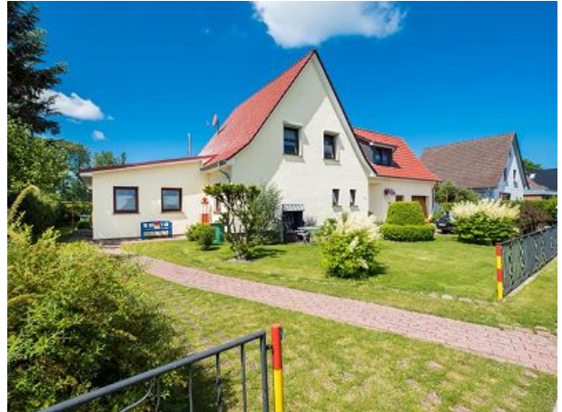
Hausansicht vom Ende Heideweg