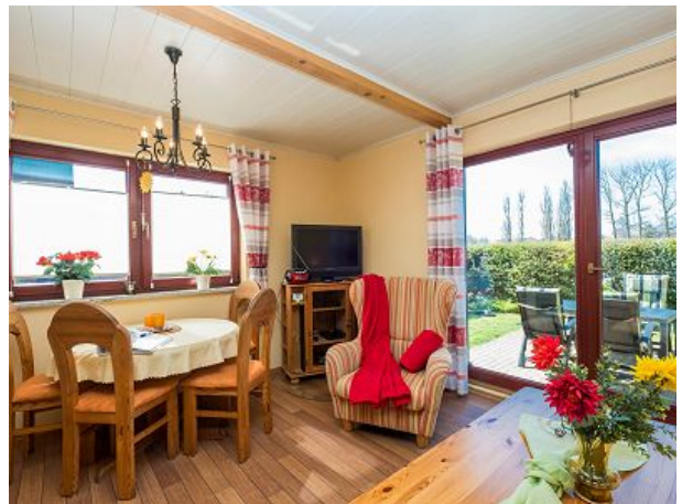
Eßbereich und Blick in den Garten