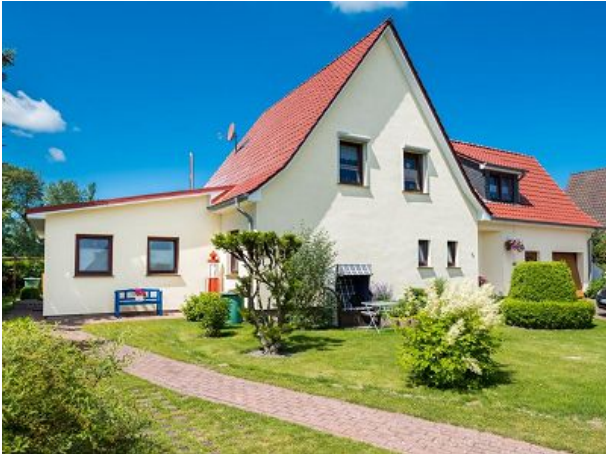
Hausansicht von Südost