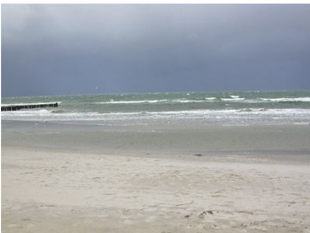
Am Strand Blick auf die See