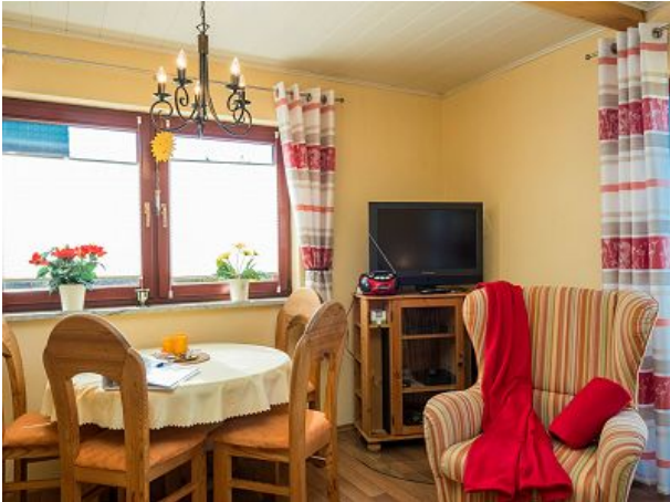
Südfenster am Eßtisch