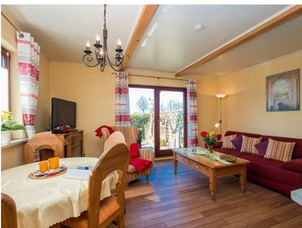
Eß- und Wohnbereich