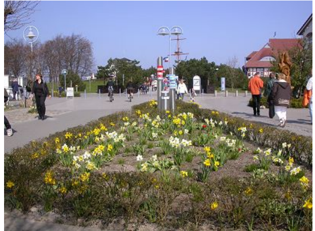
Strandstraße mit Blick Richtung Seebrück