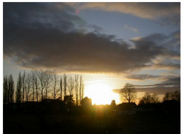
Sonnenuntergang von Terrasse gesehen