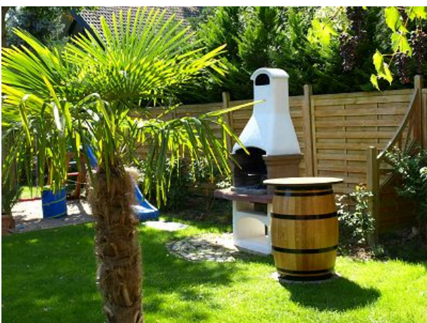
Palme mit Grillkamin