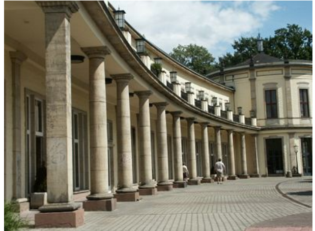
Parkgaststätte Agra Park