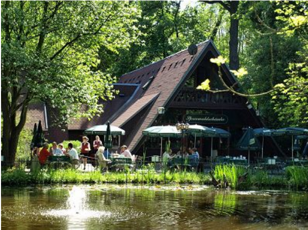
Spreewaldschänke Agra Park