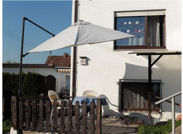
Terrasse mit Sonnenschirm