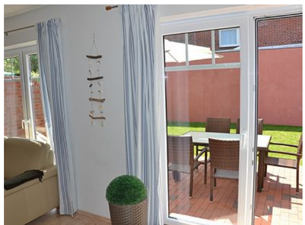
Blick auf die Terrasse