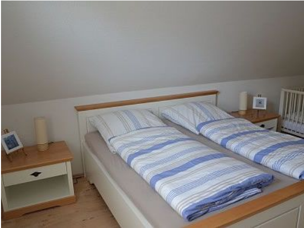
Doppelzimmer plus Kinderbett