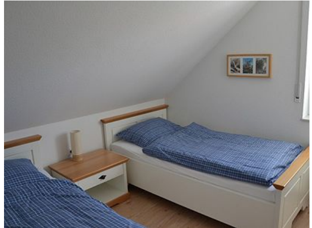
Einzelzimmer mit zwei Betten