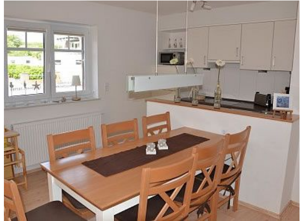
Esszimmer und Küche